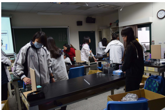
▲水溶液中超聲波速率(3)