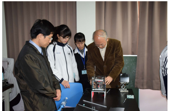
▲水溶液中超聲波速率(2)