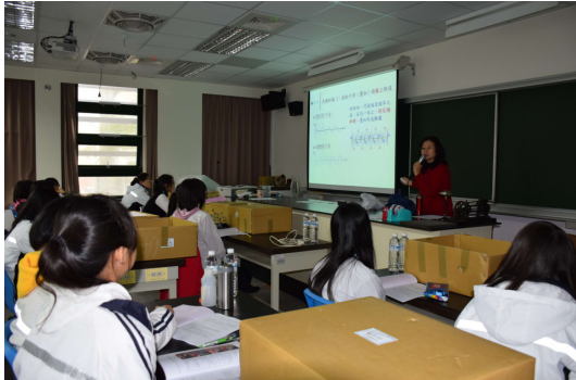
▲水溶液中超聲波速率(1)