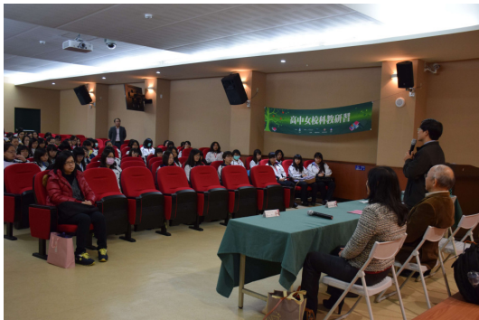
▲上午開幕校長致詞