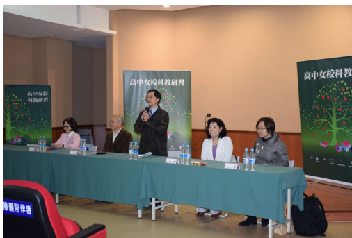
▲下午座談校長致詞