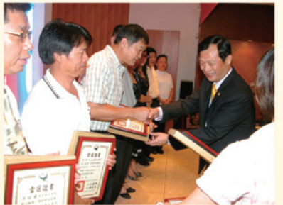
▲章會長頒發委員當選證書