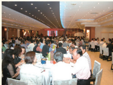
▲賀客盈門冠蓋雲集