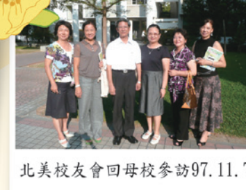
北美校友會回母校參訪97.11.7