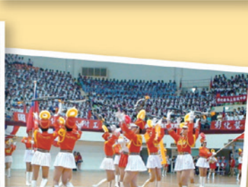
讓全場驚呼的拋槍