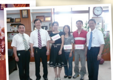
家長會長頒發獎金給指導對外 競賽得獎的老師 97.11.4