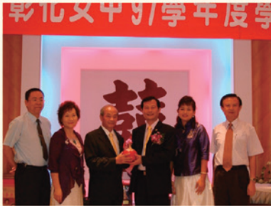
▲家長會長團致贈賀禮