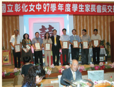
▲章會長頒發副會長當選證書