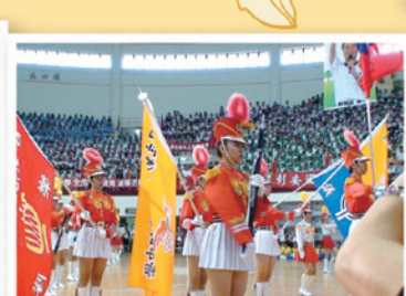
彰女精神青春飛揚