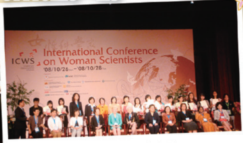
全體與會來賓會後留影