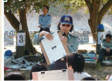
主任教官殷切叮嚀