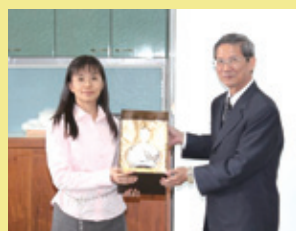
▲致贈卸任鄧主任紀念品