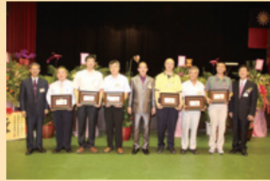
▲頒發新任委員聘書