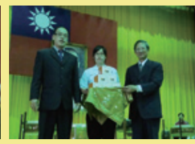
▲家長會致贈包高中禮盒