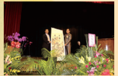
▲張副縣長致贈賀禮