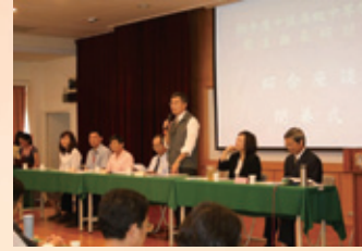
▲綜合座談及閉幕式