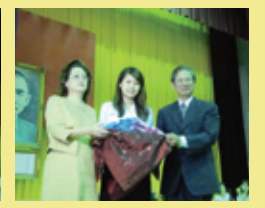
▲校友會致贈文昌筆袋