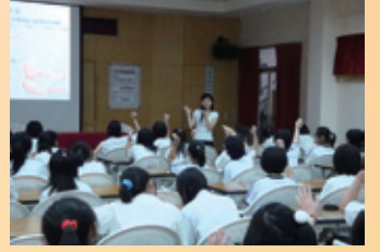
▲黃聖慧教授-如何增進英文閱讀能力