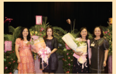
▲本校主任獻花給新(左二)卸(左三)任會長夫人