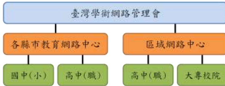
圖一、臺灣學術網路通報應變架構