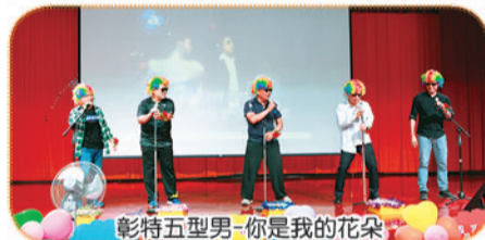
彰特五型男-你是我的花朵