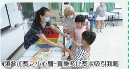
領參加獎之小心聲-養樂多比獎狀吸引我喔