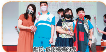
獻花-感謝媽媽的愛