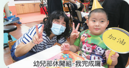
幼兒部休閒組-我完成囉