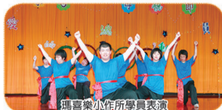
瑪喜樂小作所學員表演