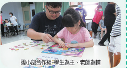
國小部合作組-學生為主、老師為輔