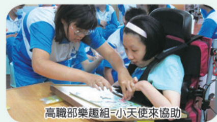
高職部樂趣組-小天使來協助

經老師們的推薦果然各班高手如雲，有趣又略帶緊張刺激的拼圖大賽順利落幕，感謝主持人的串場外加有獎徵答，也特別感謝家長會全額贊助禮券，鼓勵得獎的學生。大家繼續練練拼圖能力，我們明年再玩喔。