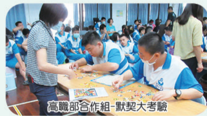
高職部合作組-默契大考驗