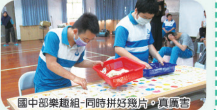
國中部的樂趣組-同時拼好幾片，真厲害