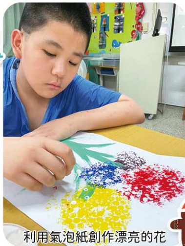
利用氣泡紙創作漂亮的花