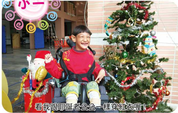
看我跟耶誕老公公一樣穿紅衣喔!