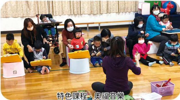
特色課程-奧福音樂