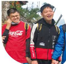
國三 2 吃吃蛋