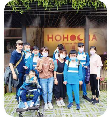
國三 1 喝喝茶