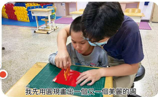
我先用圓規畫出一個又一個美麗的圓