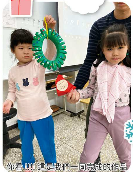
你看!!!! 這是我們一同完成的作品