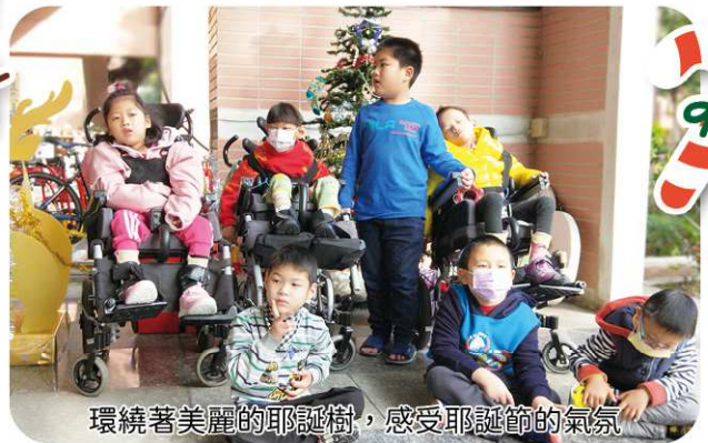
環繞著美麗的耶誕樹，感受耶誕節的氣氛