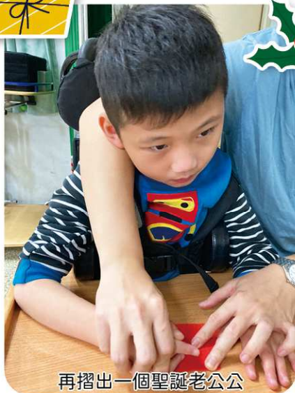
再摺出一個聖誕老公公