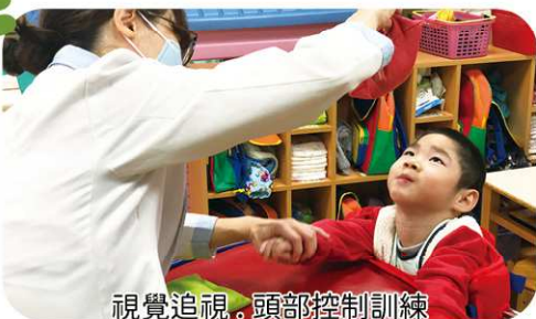
視覺追視、頭部控制訓練