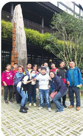
國三 2 台灣香日月潭紅茶廠