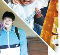
國三 2 家長群