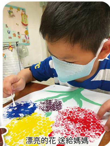
漂亮的花 送給媽媽