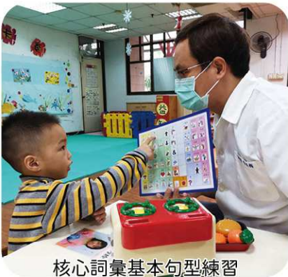
核心詞彙基本句型練習