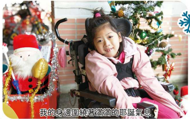
我的身邊圍繞著滿滿的耶誕氣息