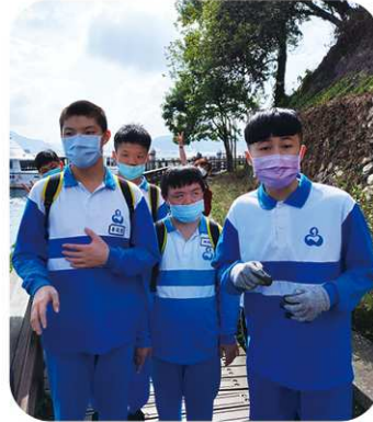
國三 1 我們在日月潭，你呢？