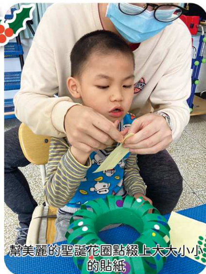
幫美麗的聖誕花園點綴上大大小小的貼紙