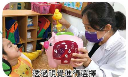
透過視覺進行選擇