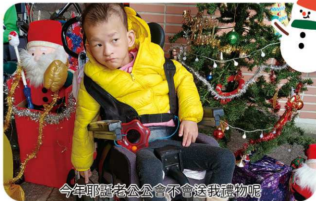
今年耶誕老公公會不會送我禮物呢