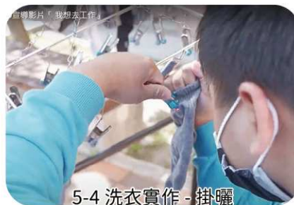
5-4 洗衣實作 - 掛曬