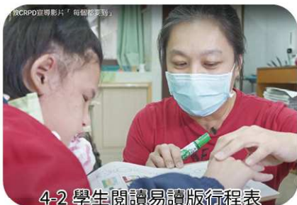
4-2 學生閱讀易讀版行程表