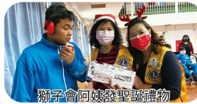
獅子會阿姨發聖誕禮物