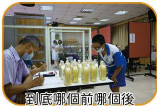
到底哪個前哪個後