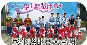
彰化縣比賽大合照