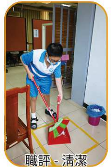
職評 - 清潔

高二每年校外實習都會分組進行實作，透過簡易的能力評估方式，讓老師先了解學生在不同職場的職業能力大概的表現，再將學生分到相對應適合的實習職場，培養職業能力。因應學生能力不若往年，以及工作職場不同，所需能力不一，實輔處正討論就能力評估面向作小幅度的調整，以利更能貼近學生能力進行測驗，做更好的能力分析與評估，也歡迎老師們就自己豐富的教學經驗，對於學生們的各項能力所見所聞，給予實輔處意見，讓我們一起努力吧！