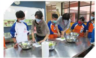
餐飲服務科課程體驗