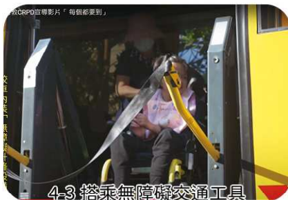
4-3 搭乘無障礙交通工具