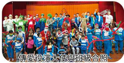
傳愛役演大使與班級合照