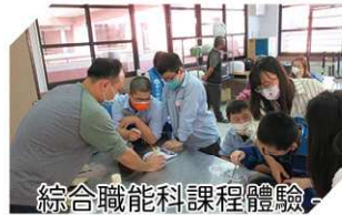
綜合職能科課程體驗-濾掛咖啡包裝