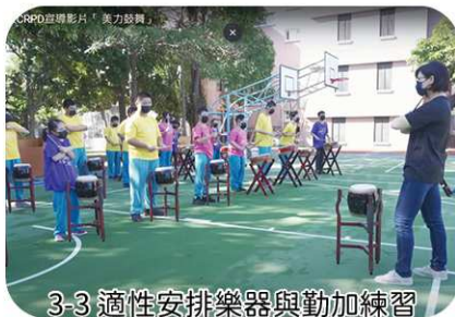
3-3 適性安排樂器與勤加練習