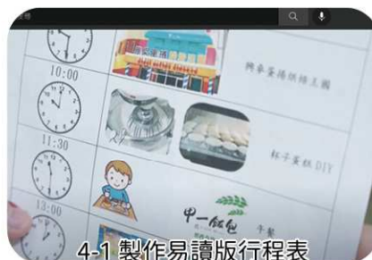
4-1 製作易讀版行程表

影片簡介：環境的無障礙，讓我參與，資訊的無障礙，助我融入，你我的無障礙，令我快樂。透過影片傳遞公約內無障礙、不歧視、機會均等、充分融入社會。