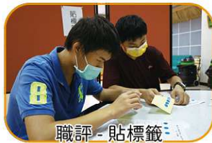
職評 - 貼標籤