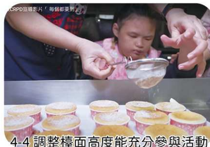
4-4 調整檯面高度能充分參與活動