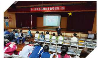
校長介紹辦學理念及特色