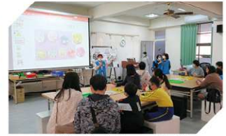
手作胸章課程體驗