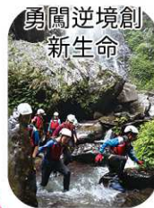
勇闖逆境創 新生命