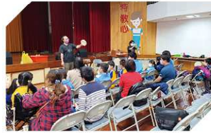
小小樂團課程體驗

本校國中及高職部師生也展現滿滿熱情，以多元豐富的表演呈現學習成果，如國中部小小樂團、直笛及獨輪車。活動中安排多項體驗課程，包括濾掛咖啡包裝、芭樂乾製作、精油乳液製作、手作胸章、粉彩藝術等課程，讓師生、家長了解本校課程與特色，並帶回自己動手作的成品。