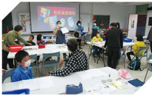
粉彩藝術課程體驗