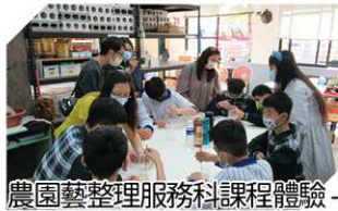
農園藝整理服務科課程體驗-我把水變成乳液