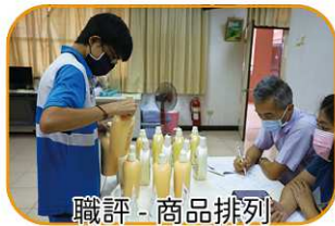
職評 - 商品排列