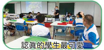
認真的學生最可愛