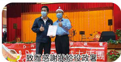
致贈感謝狀給役政署