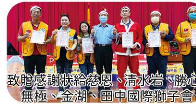
致贈感謝狀給慈恩、清水岩、勝心、無極、金湖、田中國際獅子會