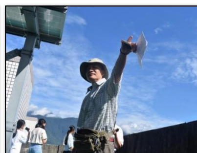
圖 3-3 地理科歐漢文老師指導學生 GIS 課程實地探查