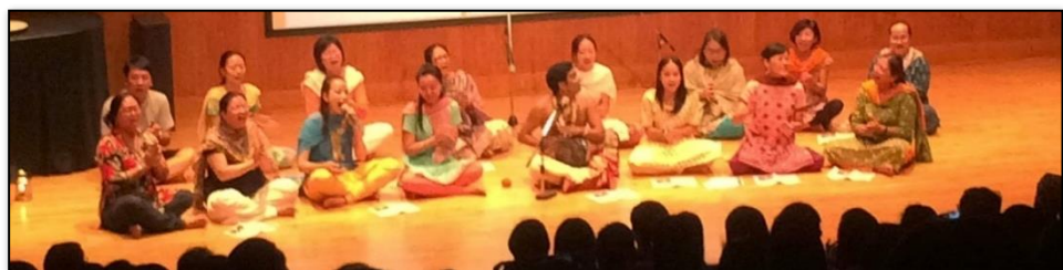
圖 3-1 學校辦理多元文化講座：印度傳統舞蹈文化演講