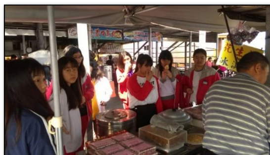
圖 3-2 花蓮漁港魚市場踏查活動