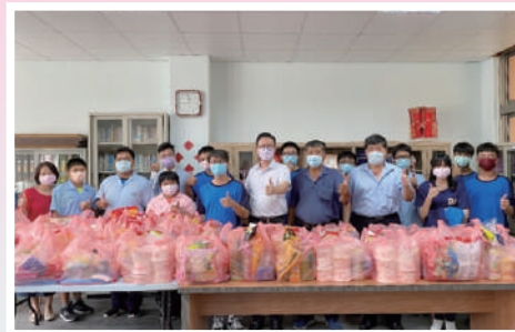
中元祈福物資活動合影

今年因為校友捐贈中元祈福物資，校友會特別辦理物資分享活動。校長親臨現場參與活動並感謝校友們的愛心捐贈。