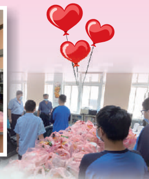
張副理事長勉勵學弟妹