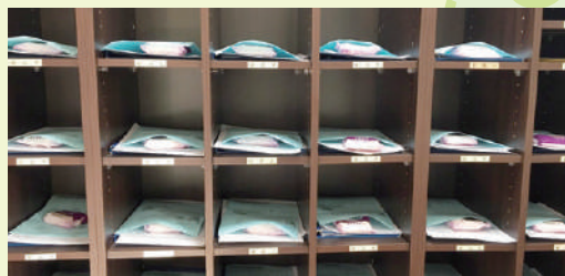
各班級發放防疫物