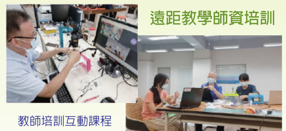
教師培訓互動課程