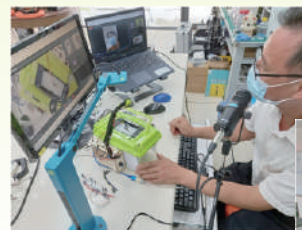
6/9(三)、6/16(三)－西螺農工魚菜共生系統研習教師培訓