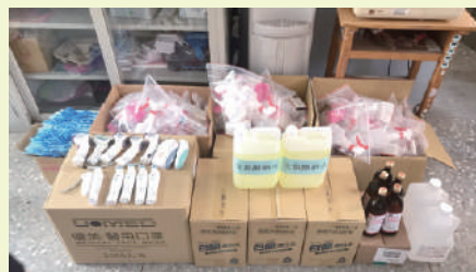
班級防護站防疫物資