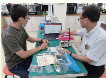
5/12師資培訓－課程講解