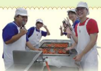
蛋黃分切，烤熟去腥