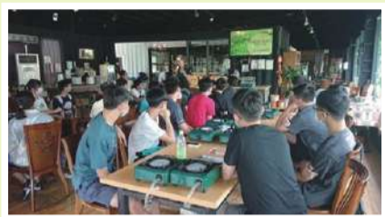
介紹智能科技農場經營理念及技術分享