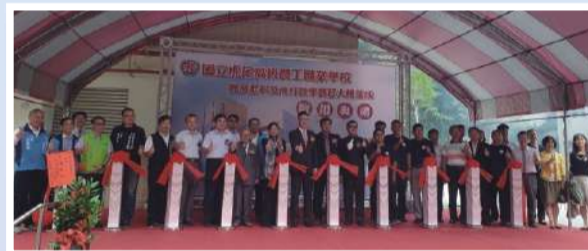
合影留念 基業永固

機械群科大樓將供機械群科進駐，內設有CAD/CAM電繪、CNC車(銑)床、選手訓練室、專題實作、及創新製造等多間實習工場，提供機械群科優質教學環境；機械被認為是「工業之母」，早期齒輪、傳動機構、汽車零組件等基礎工業製造，且隨時間演進，現今產業機械如機器人、半導體生產設備等都須機械人才支援，所以國立虎尾高級農工職業學校民國58年設機工科(機械科前身)，88年設機械製圖科(電腦機械製圖科前身)，在在顯示學校辦學及讓學生接軌企業之用心，新大樓由機械群科進駐，並整合群科內重要設備進行科際合作及教學，期將數控及電腦化精密科技設備充分運用，培育優質技術人才。