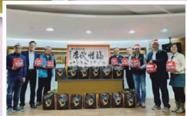
席地惜福感恩餐會