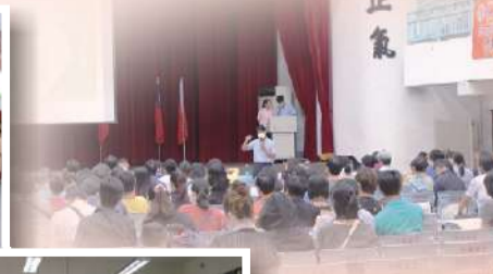
教務主任針對108課綱進行家長宣導