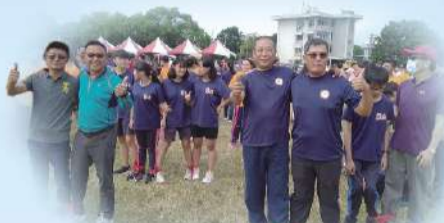
校友參加趣味競賽

109學年度校慶運動會主題「JOIN US」，希望大家能加入我們學習、運動、探索及享受的行列，秉持校長融合教育的理念，特教學生代表雲林縣參加全中運高女組柔道比賽，並擔任本屆校運會聖火代表選手，促進學生回歸主流。於籌備之初學務處即傾全處之力共同規劃，集思廣益，希望給孩子不一樣的校運會，開會開到忘了回家，把學校當成心中的家，更天真的希望縣長跟鎮長共同參與虎尾農工的校運會，雲林上場、虎農飛揚。本次校運會遭逢縣府第三期周邊道路改善工程，增添辦理困難，所幸在各處室齊心透過領隊會議與裁判會議