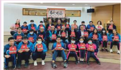
寒冬送暖活動合影