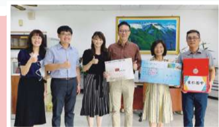
校長介紹陳大師對在地藝術的貢獻