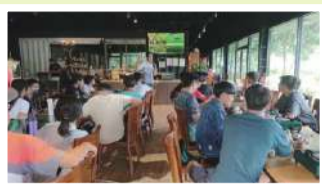
介紹土壤濕度感測器