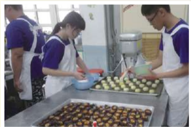
分切後刷上蛋液，提供色澤及香味