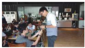
土壤濕度感測器實作及測試