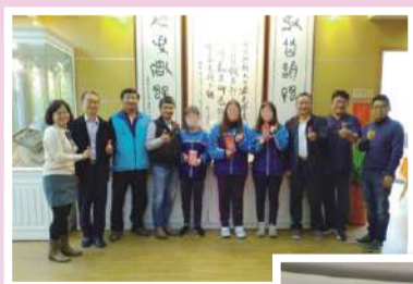
頒發急難救助獎學金