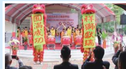
祥獅獻瑞 福臨寶地

機械群科大樓由教育部補助1億930萬元，為一棟兼具現代化、前瞻性、實用性、無障礙之教學實習大樓，地上4樓，總樓地板5,062平方公尺，於107年6月12日開工，109年8月26日取得使用執照。機械群科大樓位處校園靜、動態空間中間，是校園中心點，採座北朝南配置，配合原有綠地與穿廊空間，拉開與退縮量體，使建築能融入校園環境，且運用廣場空間區隔原有兩區開放空間，建築主體外牆以多邊形分割構成牆面突顯視覺焦點，使校園景觀更具完整性，並增添校園自明性表達。