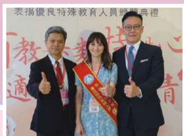
109年度優良特殊教育教師