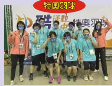
榮獲二金 二銀 一銅