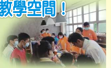
增加學習工作崗位，提高練習機會

配置烤漆玻璃，設置大量收納櫃及空間且增設開放式自動門，增加視野與美化。空間除了原有飲料調製課程外另辦理身心障礙學生適性輔導安置宣導活動、辦理學區國小職業課程體驗專業團隊入校服務-物理治療、語言治療及辦理個案輔導會議。確實達到空間活化和使用率目的。