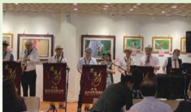
虎尾SAX管樂團精彩演奏