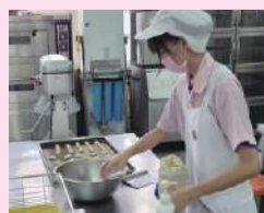
食品加工職種實作