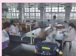
檢驗分析職種考試

食品加工科於舉辦了110學年度農業類食品群技藝競賽，先以學科測驗篩出優秀的學生後，再透過術科考試決定食品加工職種、食品檢驗分析兩職種培訓選手，將於暑假進行培訓，為11月的全國技藝競賽做好準備，為校爭光。