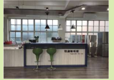
辦理身心障礙學生適性輔導安置宣導

增設服務櫃檯，鏡台及大量收納櫃，物品收納整齊又美觀。地面架高，包覆水電管路，美觀又安全。除了原有美髮實作課程，提供校內彈性學習課程使用，辦理校內特教宣導週入班體驗活動。提升空間使用率，確實達到空間活化的目的。