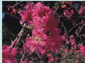
大地回春-櫻花綻放 商經二 曾泊澐