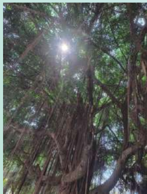
灑落樹梢間的那道晨光 商經二 邱翰陞