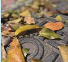
落葉藏愁 商三甲 郭佳玗