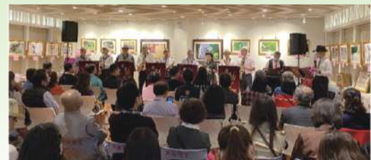
音樂會開幕大合奏