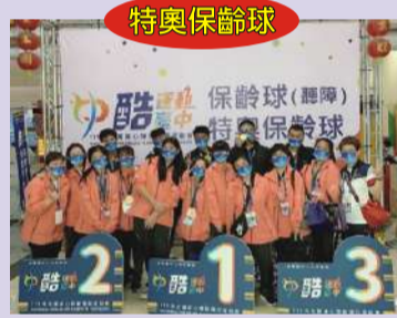
榮獲三金 一銀 二銅