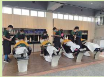
增加動線流暢度，分組進行練習與測驗