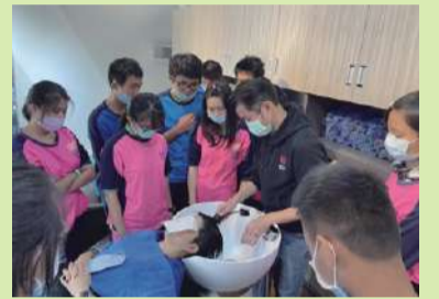
教師示範服務客人流程，學生在旁學習