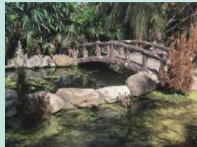
小橋流水向東流 商經二 李郁竣