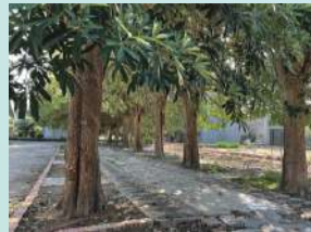
悠然小徑，一起散散步吧！ 商經二 郭菩生