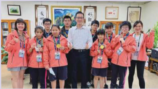
校長親自恭賀這群勇敢追夢的天使

特殊教育組長以及門市服務科6位老師帶領26位學生代表雲林縣參加4月7日至4月11日於台中市舉辦的111年全國身心障礙國民運動會，於特奧各競賽項目榮獲佳績。