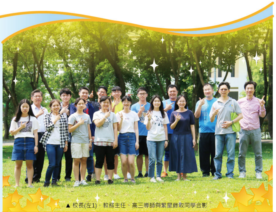
▲ 校長(左1)、教務主任、高三導師與繁星錄取同學合影