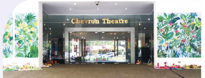
▲ 曼谷國際學校的學生藝廊，玻璃門後展示的是學生的作品。

此趟行程中，不僅可以認識東亞地區優秀的國際教師，並與這些傑出的教育人員交流以及學習。更重要的是，實際踏進國際學校之門，讓人實際感受到國際學校應有的格局及視野。而在與行政人員的對話當中，才得以瞭解成立國際學校之不易，以及如何在行政面一點一滴構築學生的國際移動能力。