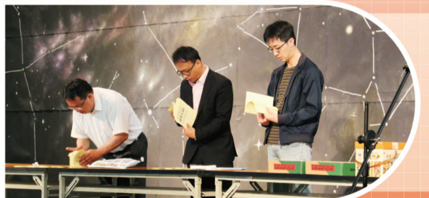
▲ 公正人士點籤 (輔導會長、園區公會代表、中科管理局代表)

抽籤結果名單公告於本校網站，正取生須完成報到手續後，所留缺額再當場依序唱名由備取生遞補。國中部招生抽籤過程全程錄影，現場亦邀請社會公正人士協助驗籤、點籤等作業皆公開透明化。當日多為學生親自上台抽籤，不少家長表示，讓小孩子上台抽籤，除了是生命的重要經驗，亦有「未來決定在己」的意義。