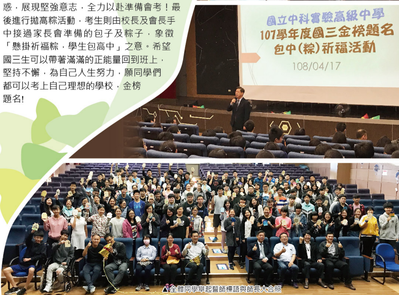
▲ 全體同學舉起誓師標語與師長大合照

國立中科實驗高級中學 107 學年度國三金榜題名 包中(粽)祈福活動 108/04/17