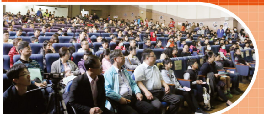
▲ 園區生抽籤現場盛況