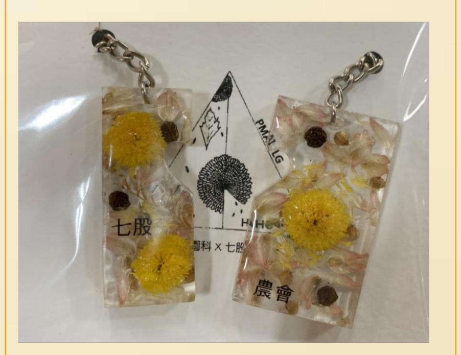
圖21. 杭菊創意鑰匙圈