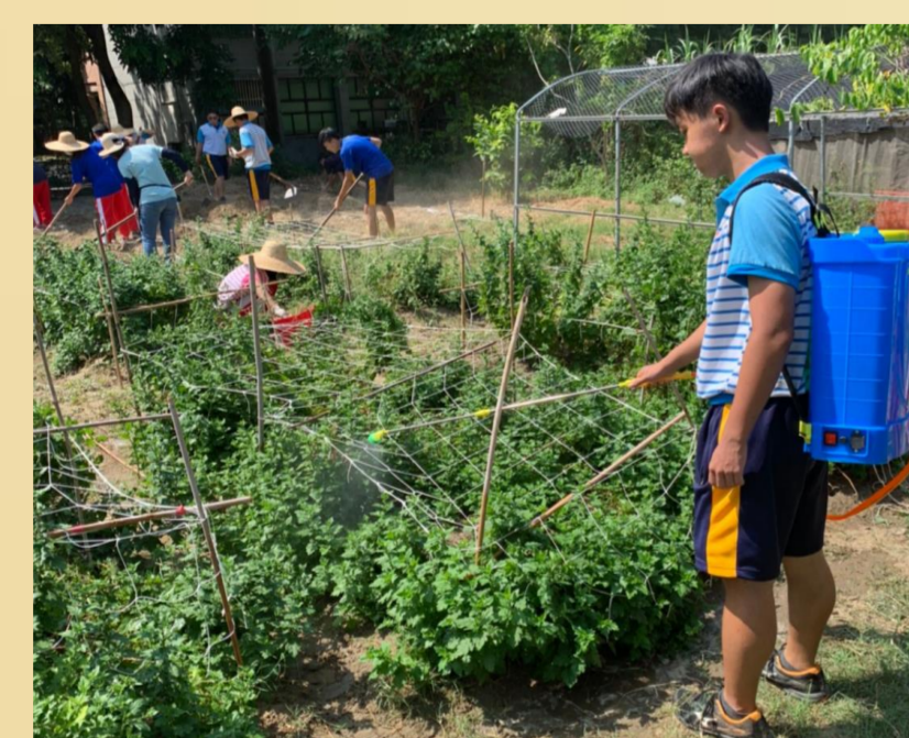
圖11. 噴灑生物性農藥