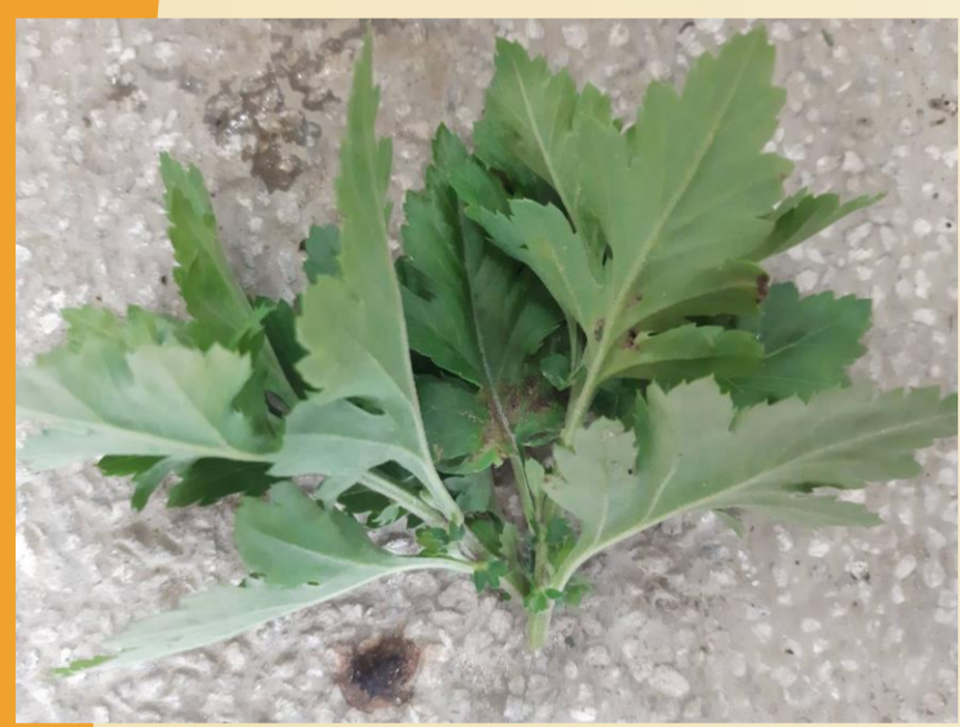
圖1. 取杭菊頂梢7-10公分