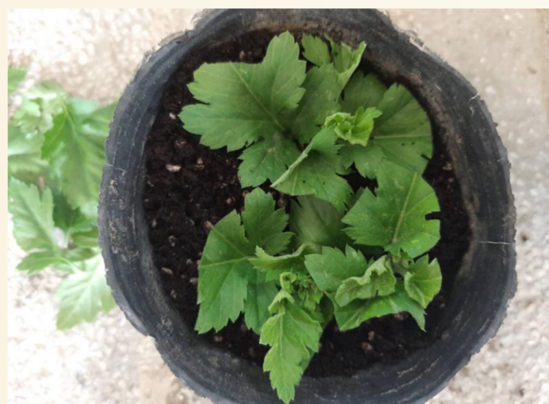
圖3. 插入調配好之介質中