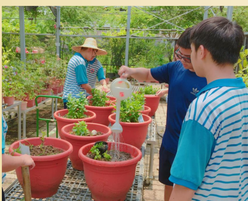
圖8. 盆植杭菊之管理