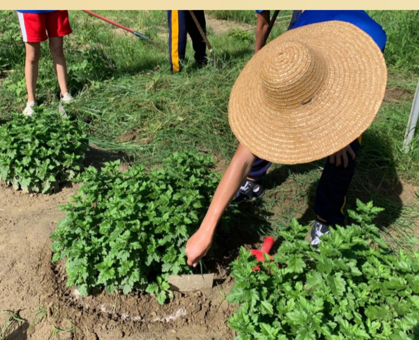
圖7. 田間杭菊肥培管理