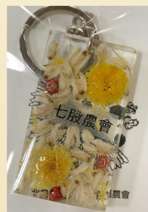
圖22. 杭菊創意鑰匙圈