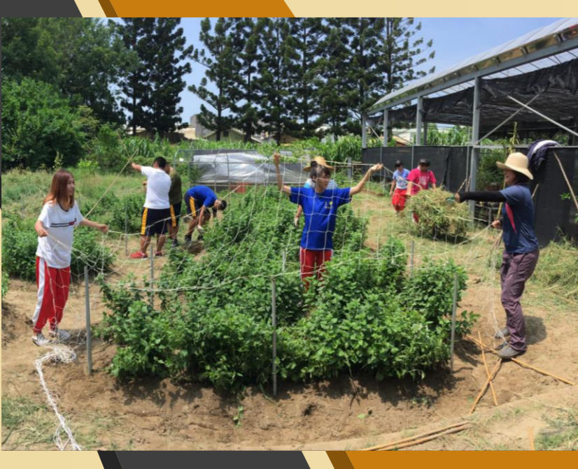
圖10. 立支柱並架設尼龍網