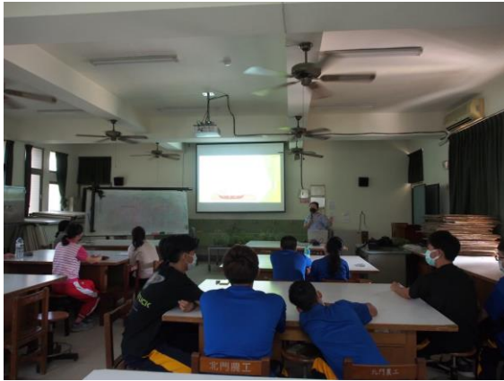
說明野性花園定義