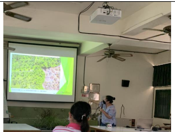
介紹野性花園常用植栽