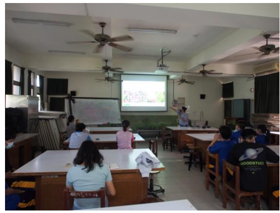
介紹野性花園案例