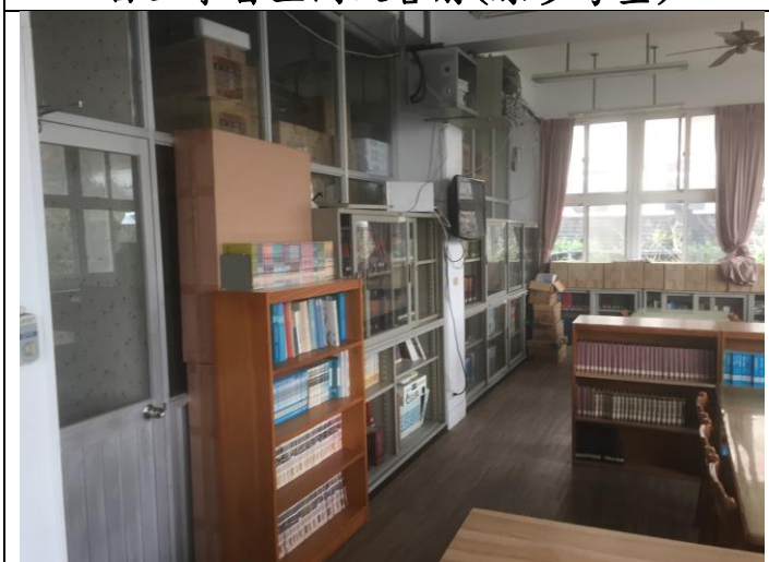
自主學習空間改善前(原參考室)