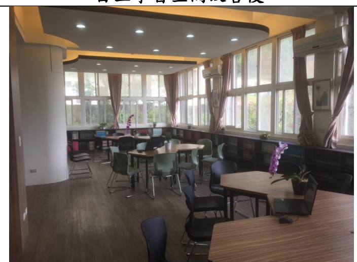
自主學習空間改善後