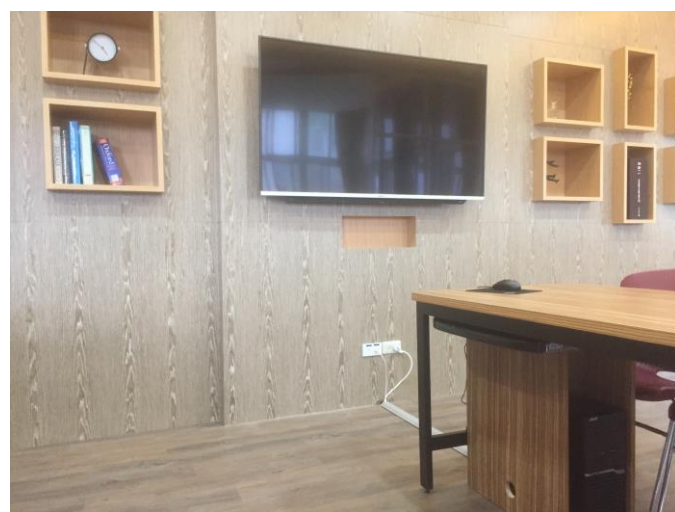
新購置電腦 2 台及大型液晶螢幕一座