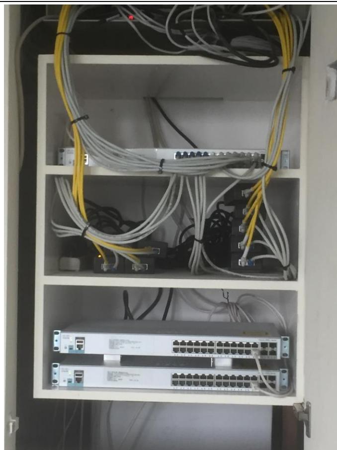
新購網管型交換器 3 台