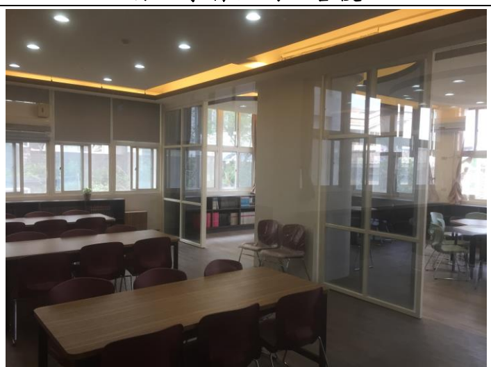
自主學習空間改善後