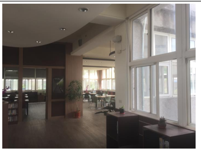
自主學習空間改善後