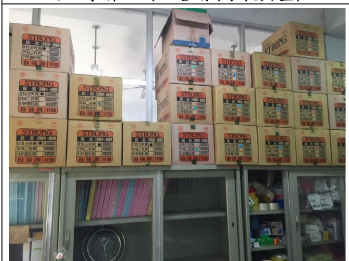
自主學習空間改善前(原教具室)