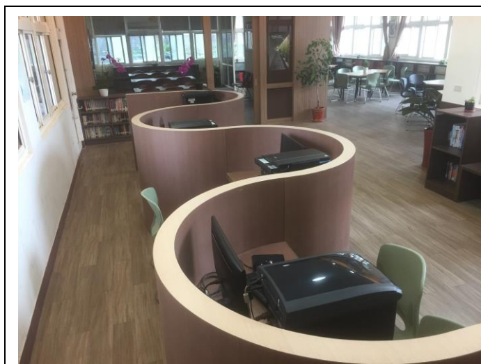
新購置掃描器 3 台