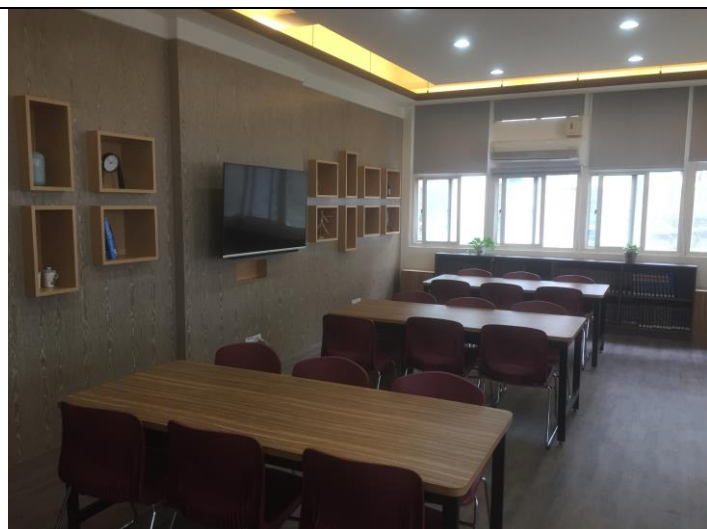
自主學習空間改善後