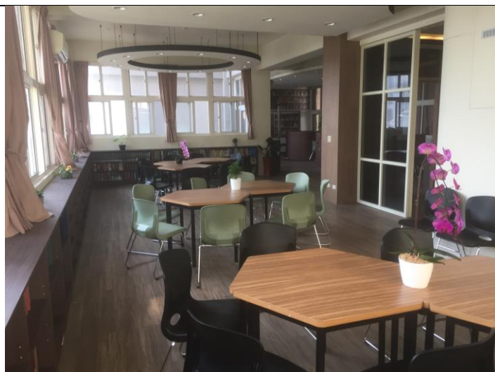
自主學習空間改善後