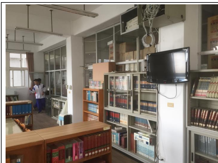
自主學習空間改善前(原參考室)