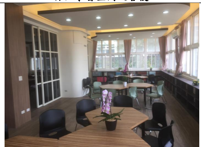
自主學習空間改善後