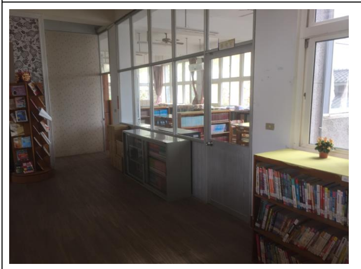
自主學習空間改善前(原參考室)