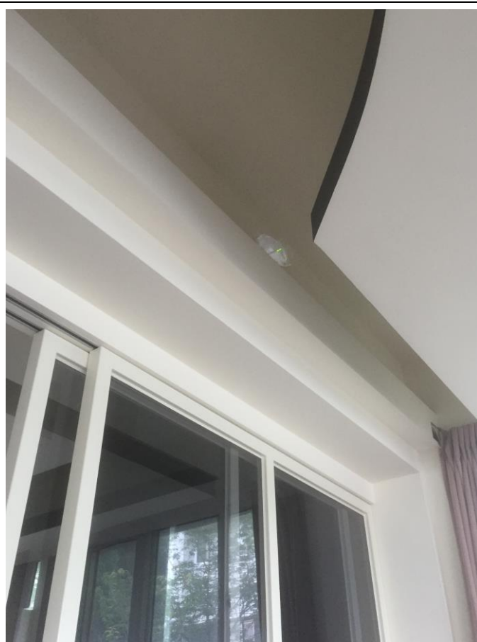
新設無線 AP 6 台