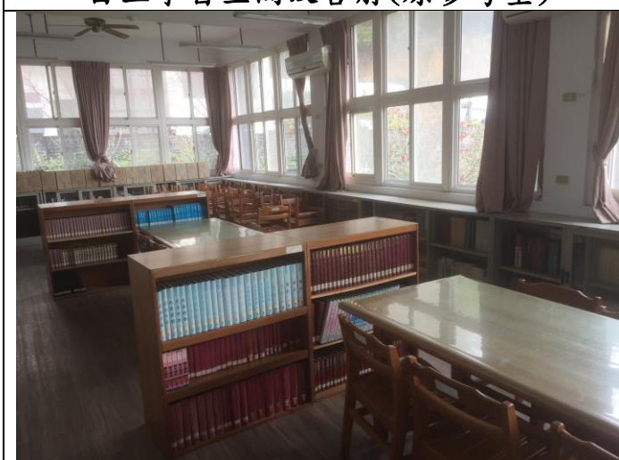
自主學習空間改善前(原參考室)