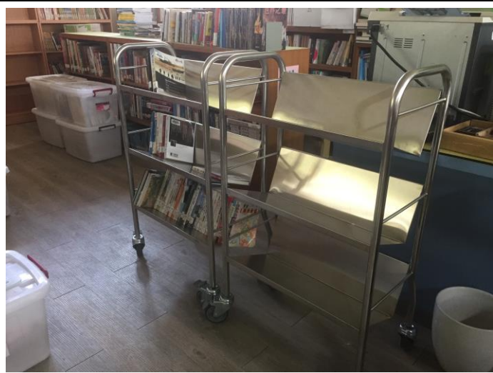
新購置運書車 2 台