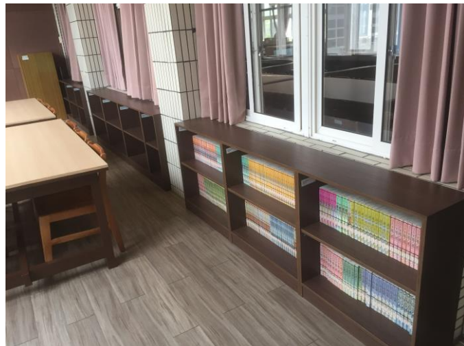
書架及書桌增設及更新桌面前