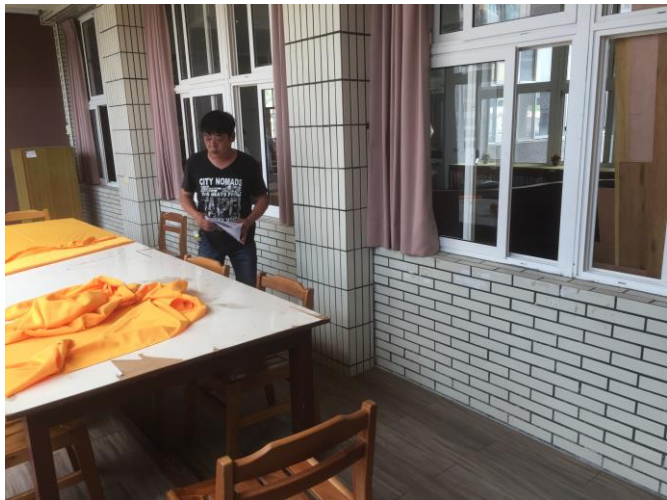
書架及書桌未增設及更新桌面前