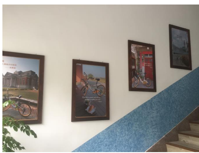
增設閱讀佳句畫板