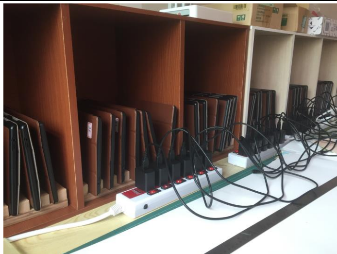
新購置平板電腦 44 台