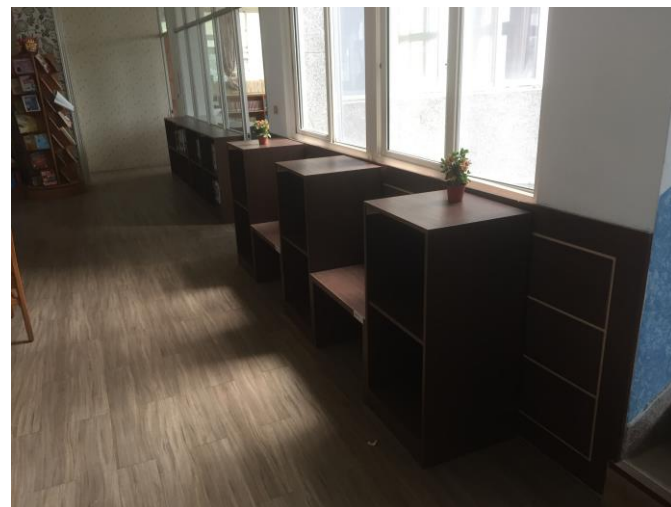
增設書架及造型閱讀椅前後