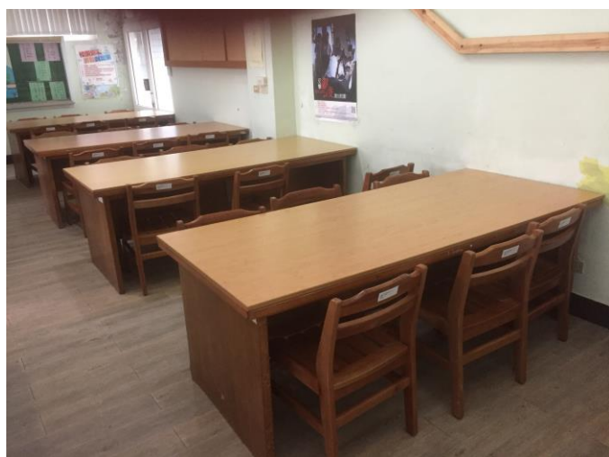
新購閱讀椅 110 張