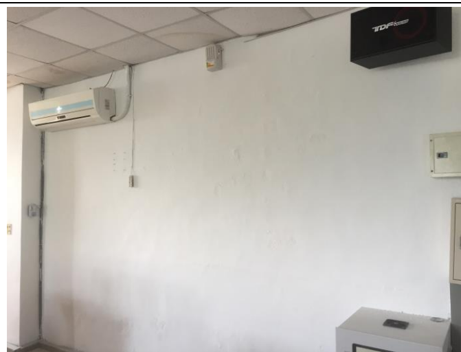
油漆及壁癌處理後