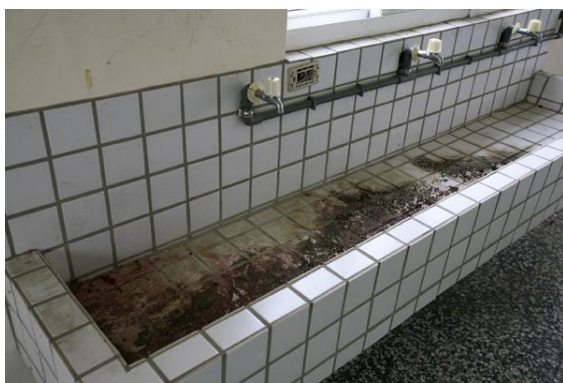
更新前：洗手檯管線紊亂、髒汙， 電源位置於檯座上方，有危險疑慮