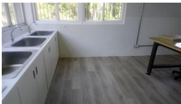
更新後：地面突起障礙物清除，並鋪設超耐磨地板