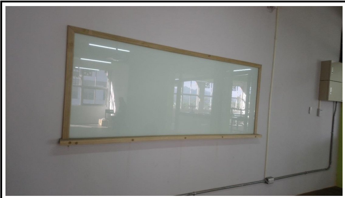
多媒體教學區新增烤漆玻璃白板