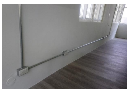
更新後：將舊好的洗手槽拆除變 換位置，新拉電源線並將位於下 移，增加使用的安全性