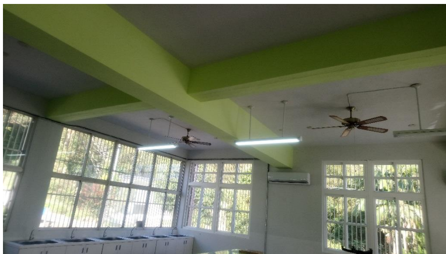
更新後：全面更換為 LED 節能燈具(T8)