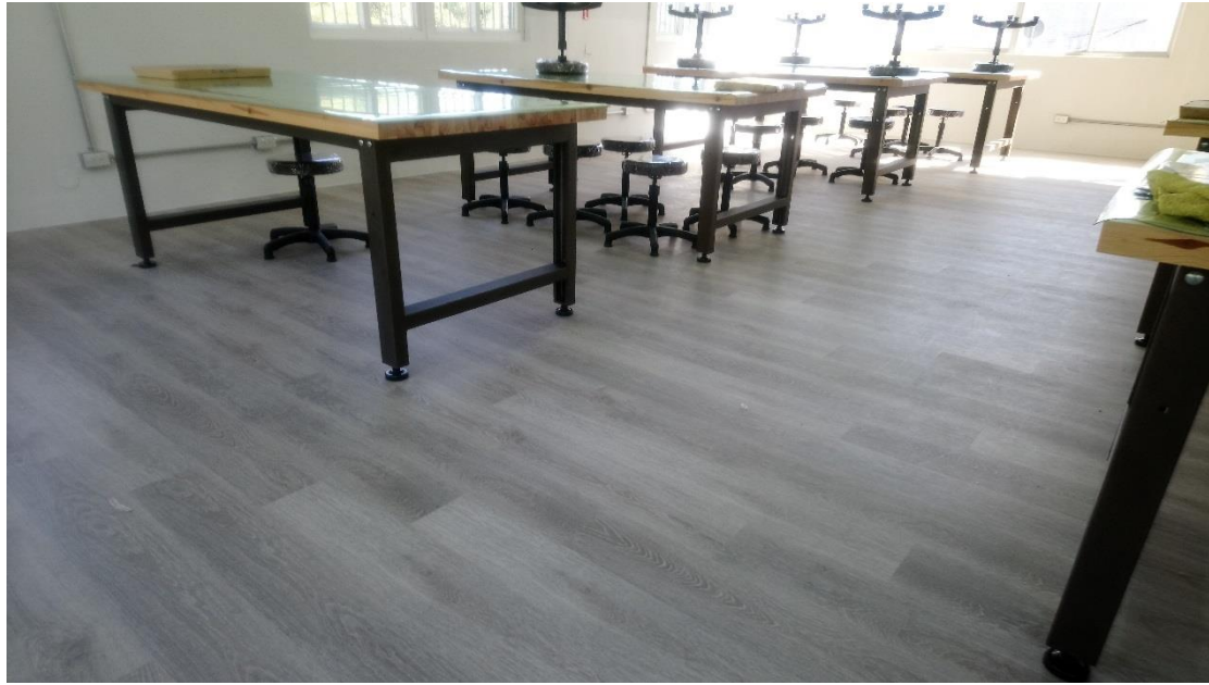
更新後：全面鋪設超耐磨地板