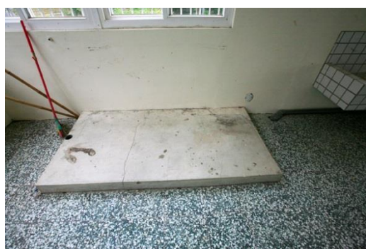
更新前：地板老舊破損，部分有突起障礙物