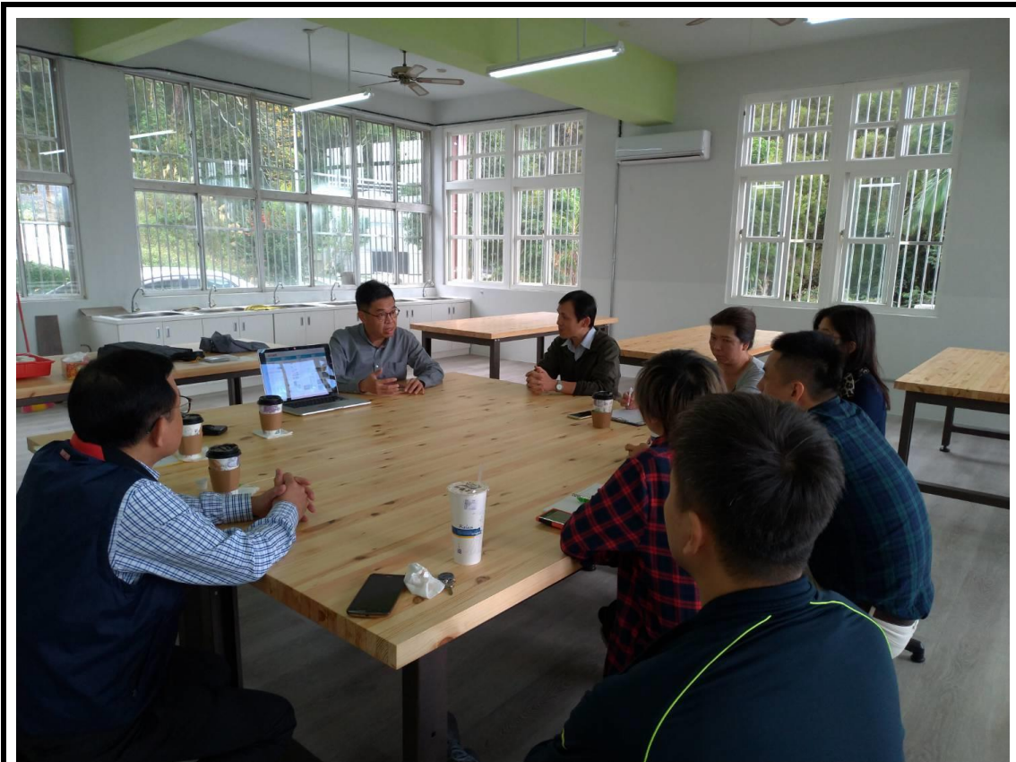
107年12月11日辦理跨域文創課程諮詢會議