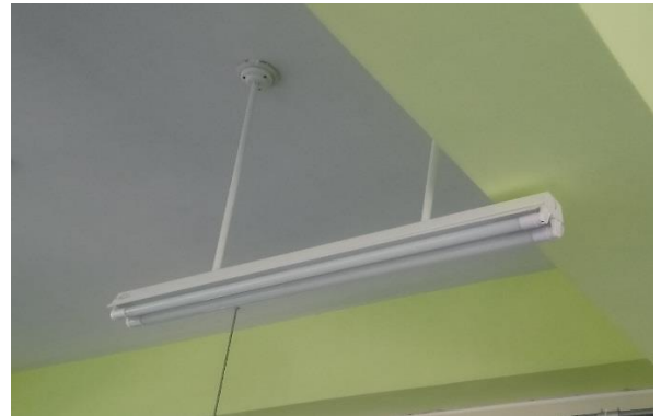
更新後：更換 LED 節能燈具(T8)