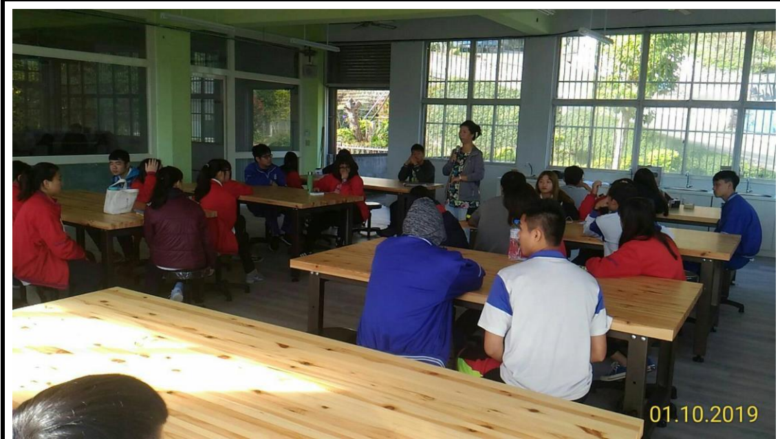
108年1月10日跨域文創課程進行三科匯集報告