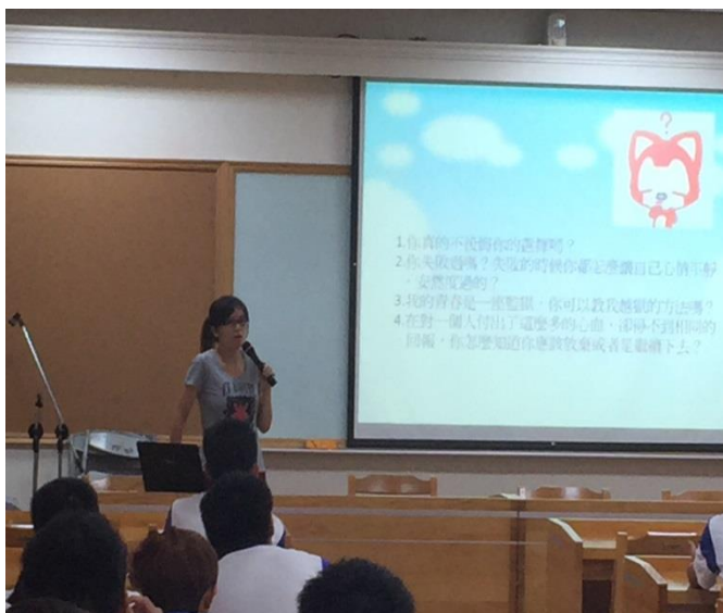
國文老師進行閱讀導讀