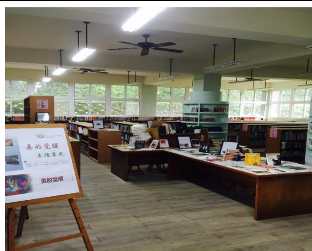
美的覺醒主題書展