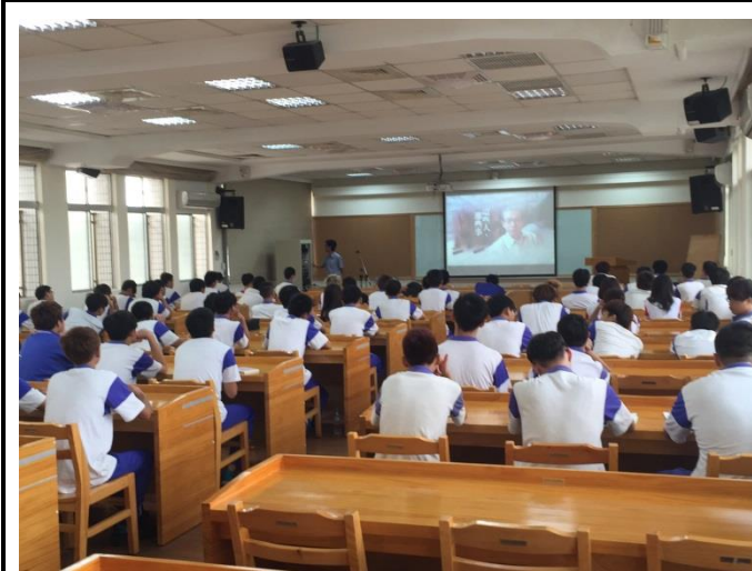
生活中的美感晨讀分享