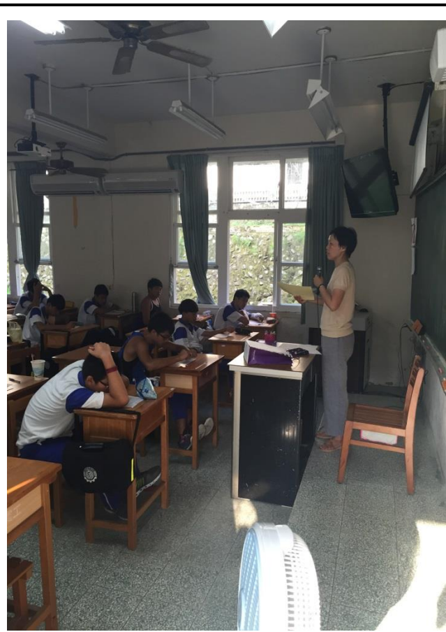
國文老師進行閱讀導讀