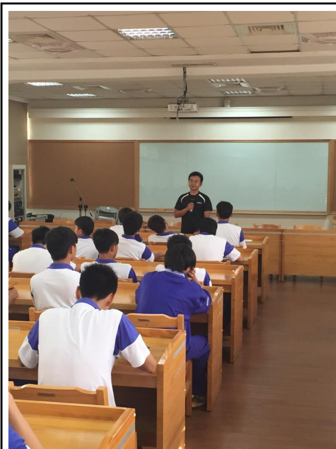
國文老師進行閱讀導讀