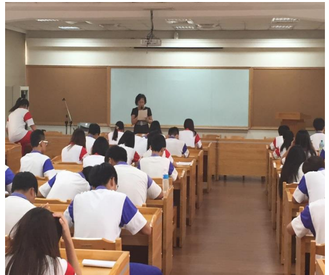
國文老師進行閱讀導讀