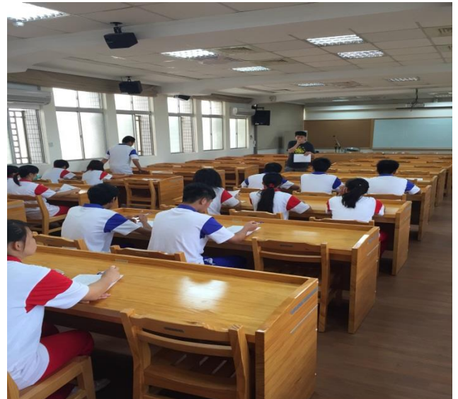
國文老師進行閱讀導讀