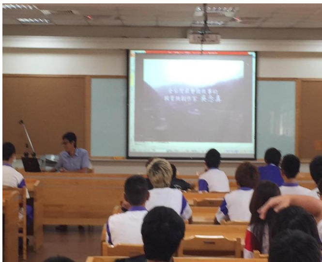
國文老師進行閱讀導讀