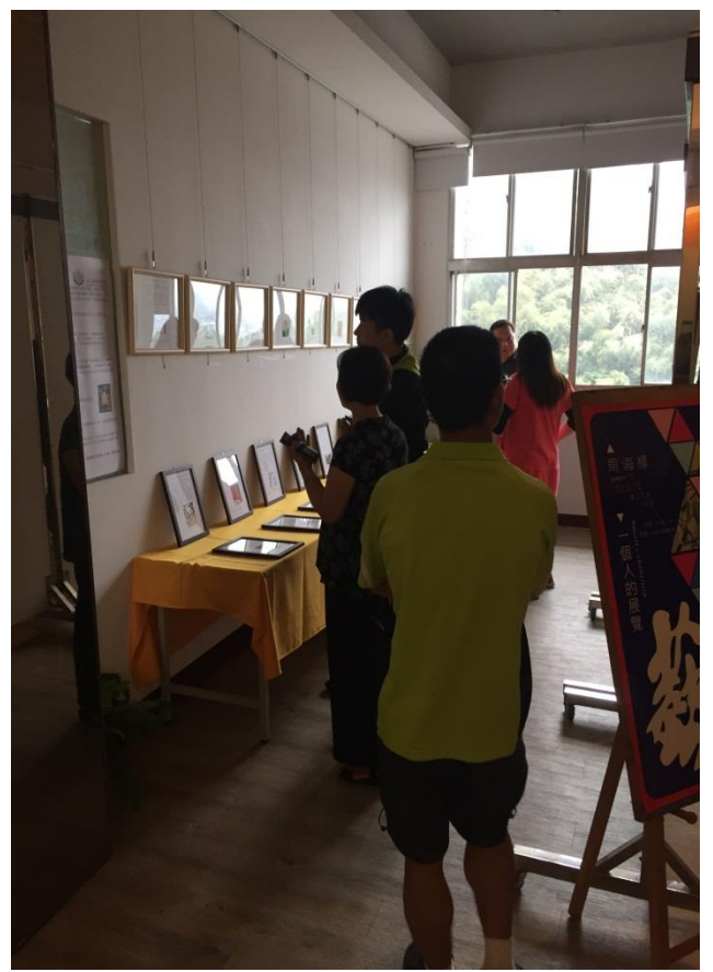
得獎作品於校慶展示