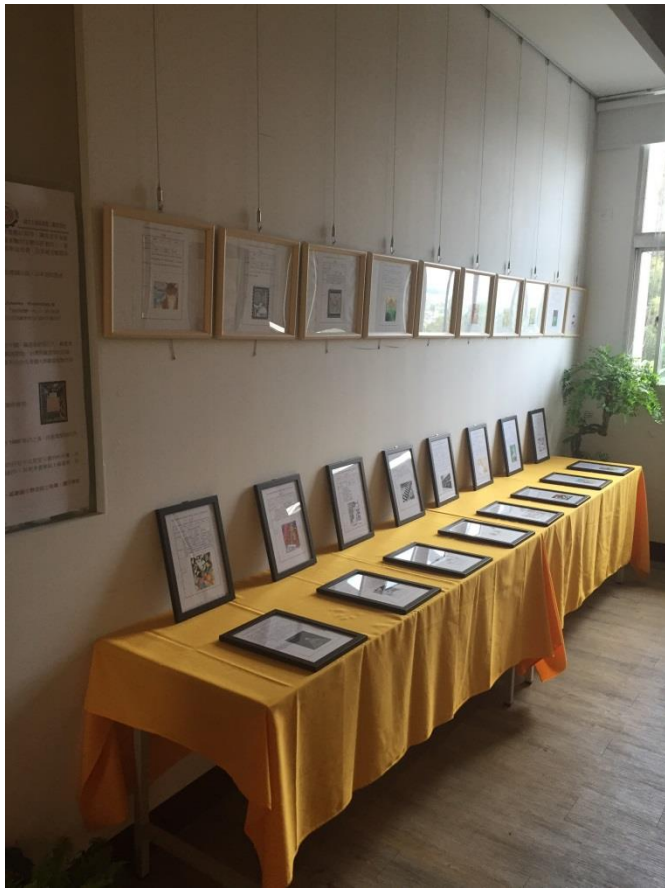
得獎作品於校慶展示