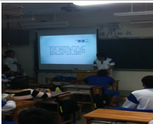
班級讀書會發表與討論