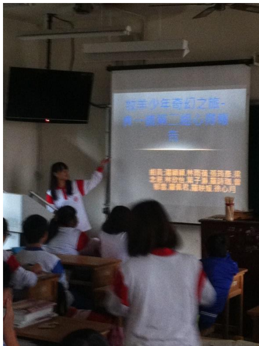
班級讀書會發表與討論