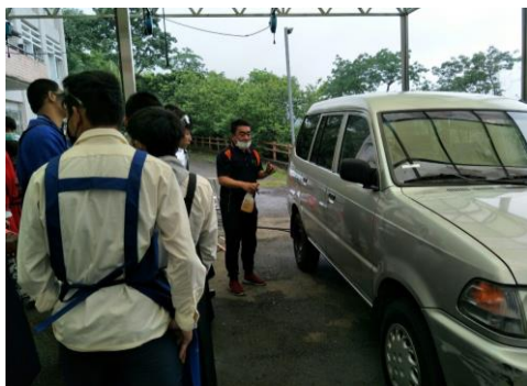
時間:109.04.24 地點:機械科洗車場 內容: 講師示範噴灑柏油清潔劑使用範圍