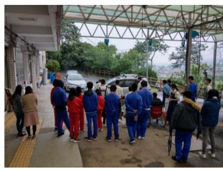
時間:109.04.24 地點:機械科洗車場 內容: 老師及學生們認真聆聽