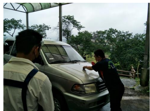
時間:109.04.24 地點:機械科洗車場 內容: 講師示範美容黏土使用方式