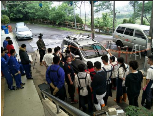
時間:109.04.24 地點:機械科洗車場 內容: 講師指導學生打蠟機之使用方法