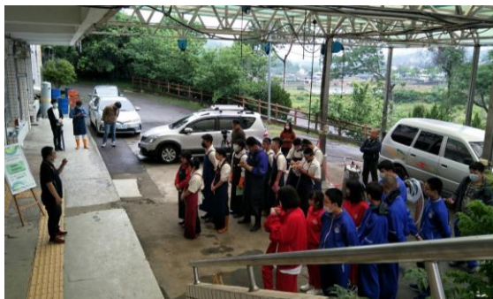
時間:109.04.24 地點:機械科洗車場 內容: 講師說明今日課程內容