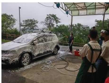
時間:109.04.24 地點:機械科洗車場 內容: 講師示範泡沫噴灑使用方式