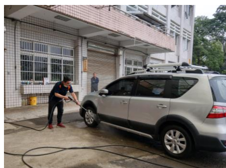
時間:109.04.24 地點:機械科洗車場 內容: 講師示範高壓噴水使用方法