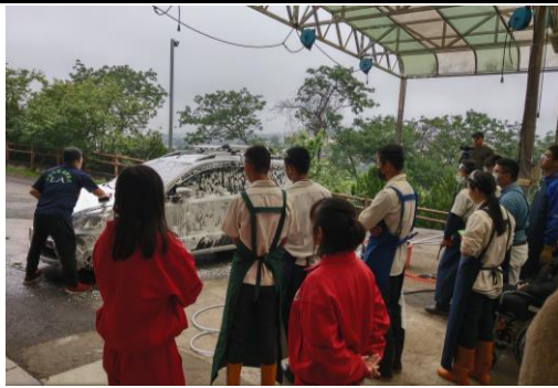
時間:109.04.24 地點:機械科洗車場 內容: 講師示範使用海綿擦洗車