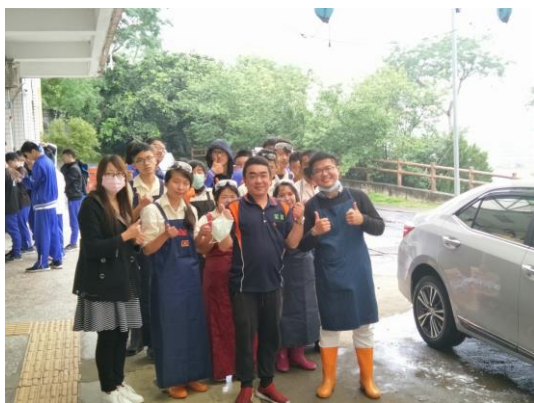
時間:109.04.24 地點:機械科洗車場 內容: 講師與研習師生合影