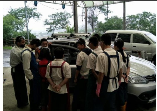
時間:109.04.24 地點:機械科洗車場 內容: 講師講解如何檢視玻璃是否有擦乾淨