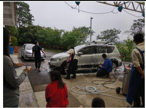
時間:109.04.24 地點:機械科洗車場 內容: 講師指導學生使用海綿擦洗車