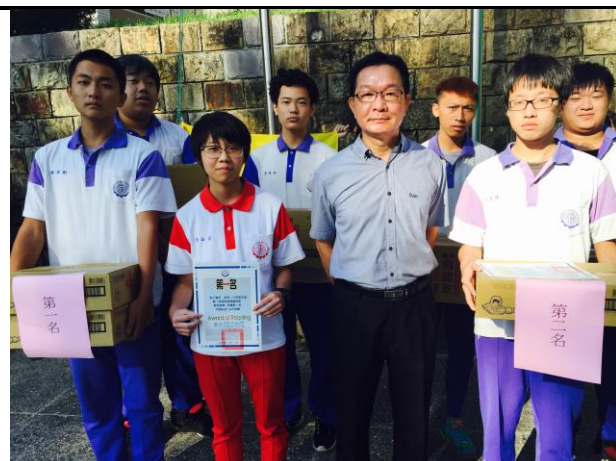
時間:109.6.9 地點:內操場 內容:校長頒發班級閱讀認證獎狀及獎品