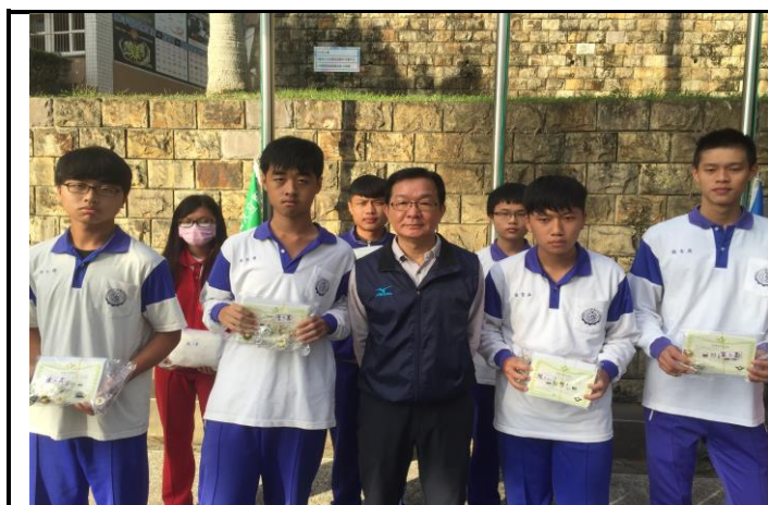
時間:109.10.20 地點:內操場 內容:校長頒發個人閱讀認證星級證書