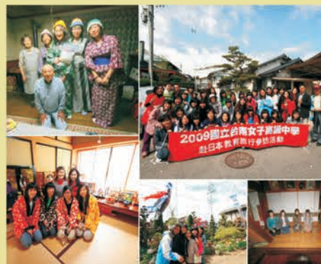
日本へ教育旅行、文化学習