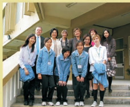
フランスの高等学校長が来訪