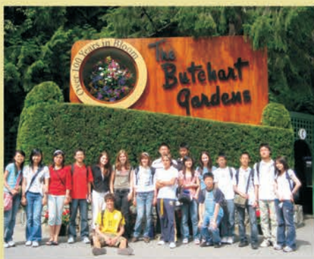
夏期休暇に海外留学