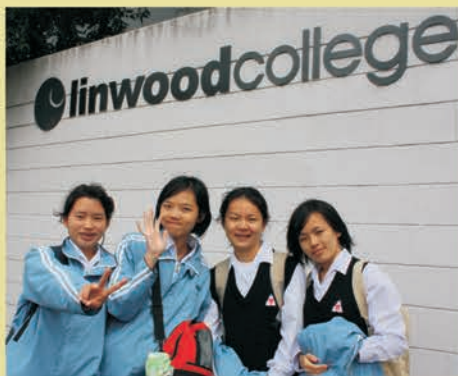
ニュージーランドへ海外体験学習の旅