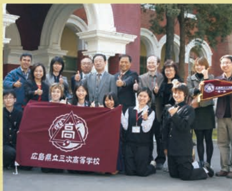
日本の広島県立三次高校が来訪