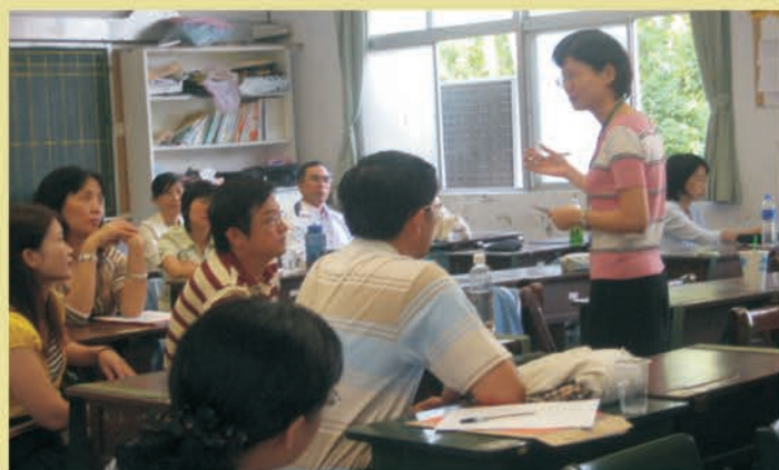
親と教師の座談会で、学生の生活に関心を払う