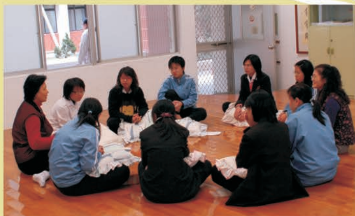
全体相談、人生を模索