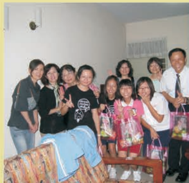
ボランティアグループは寄宿舎の生活を気遣います