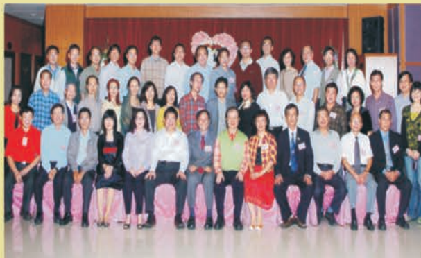
校務を全力で支援する保護者ボランティア