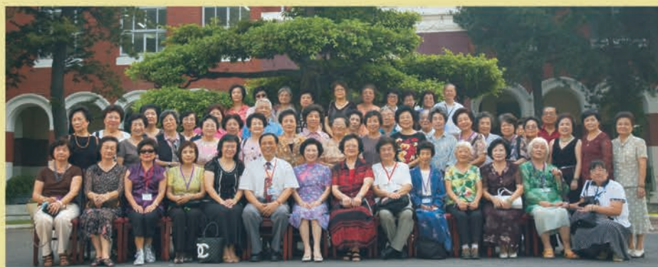
卒業生の母校訪問をいつでも歓迎します