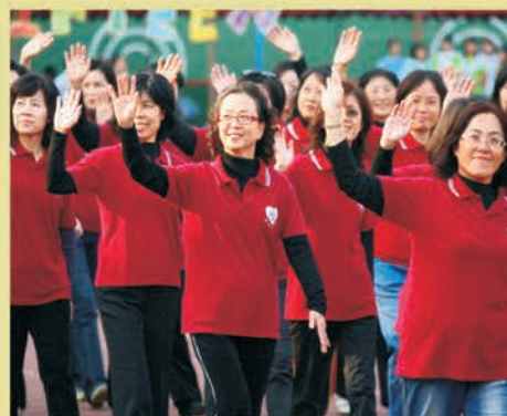
赤いシャツを着たボランティアは校内にぬくもりを与えます