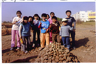
這是小朋友堆的小窯，後來真的有用！