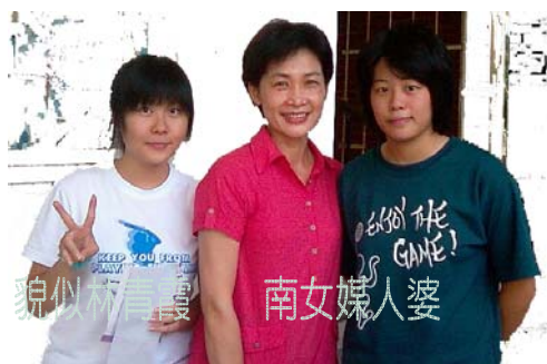
貌似林青霞 南女媒人婆