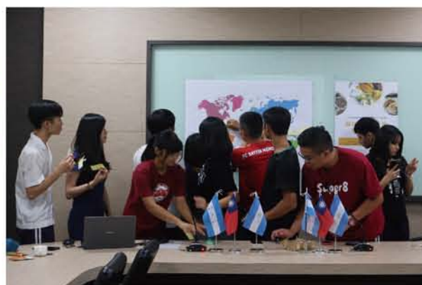
同學們一起在世界地圖中標記台灣的邦交國 17 個