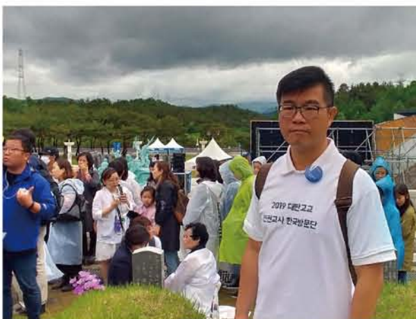
20190518 五一八紀念墓園裡，我們聆聽著 39 年前光州事件失去兒子的母親，訴說心碎的歷史 (我身後墓碑前全白衣女士)

本校公民科張豐琦老師為 2019 年人權教育課程研發團隊成員之一，與知韓文化協會執行長兼任講師朱立熙、二二八基金會副執行長柳照遠等五名專家學者、國教署人權教育資源中心以及來自全台北中南各地之高中教師多名，於 108 年 5 月 17 日至 5 月 22 日，一同前往韓國進行參訪。