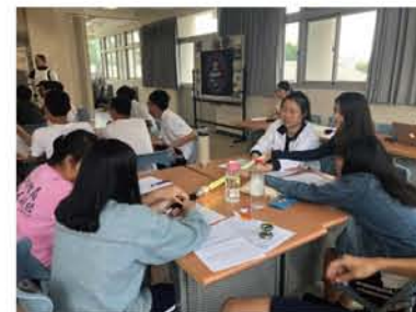
學生們很好奇地把玩星際大戰的道具

新聞連結： http://www.cdns.com.tw/news.php?n_id=26&nc_id=300996