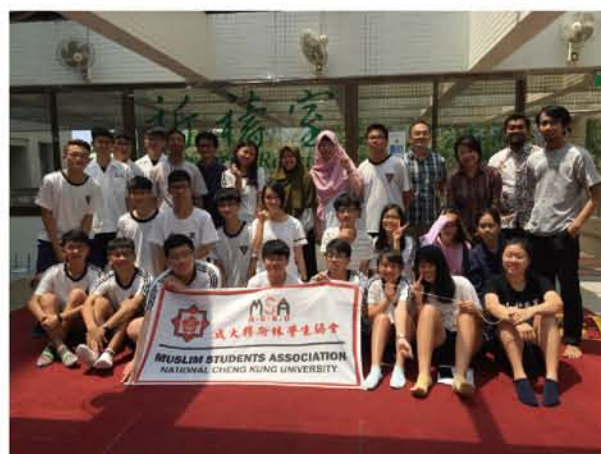
成大宿舍內的祈禱室外大合照