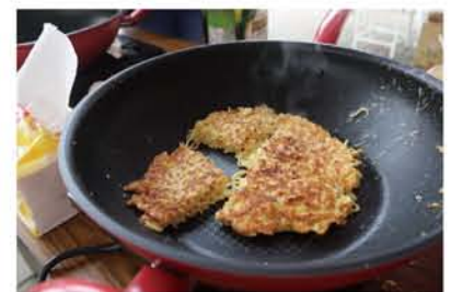
印尼道地風味炒泡麵