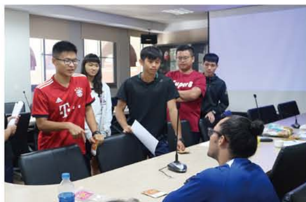
學生和成大邦交國學生活動後交流