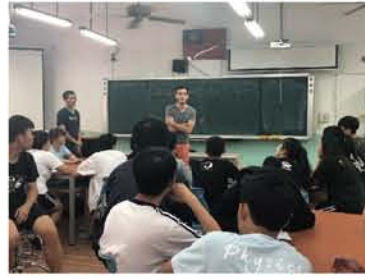
與學生的 Q&A 時間