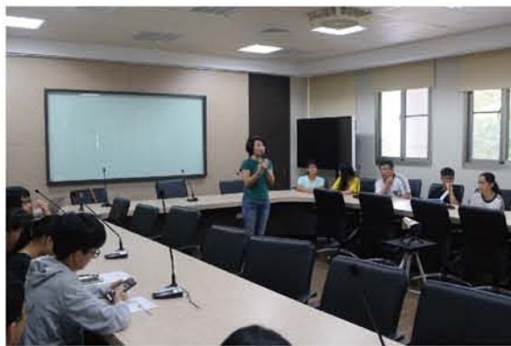
余月琴老師為此次視訊交流開場