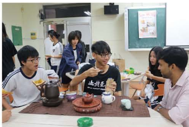
選修課的學生示範如何泡一杯好喝的烏龍茶