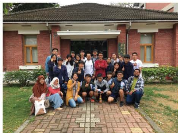
學生們用英文和成大穆斯林交換生交流後大合照