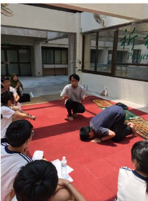
成大穆斯林學生會祈禱示範

這門課的鋪陳安排，沒有功課沒有考試，即使如此依然不輕鬆，學生需要不斷嘗試從不同角度切入伊斯蘭文化。教育界也有個活動「教學必須與學生的生活情境結合」，學生才能真正感受到社會的議題，最後能帶著離開高中校園。同理尊重，這四個字是余月琴老師想傳遞給學生的觀念，不單是對伊斯蘭文化，甚至在臺灣社會上許多容易被偏頗、被貼上負面標籤的事情，任何議題都希望學生能學著去思考、反省。余月琴老師對這門課最大的期待是能夠延續到生活上，當學生走出社會，所面臨到一些容易被刻板印象、媒體塑造成較為負面的事情，都要能夠加以反思。