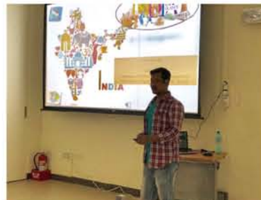
Litan 用 PPT 介紹印度