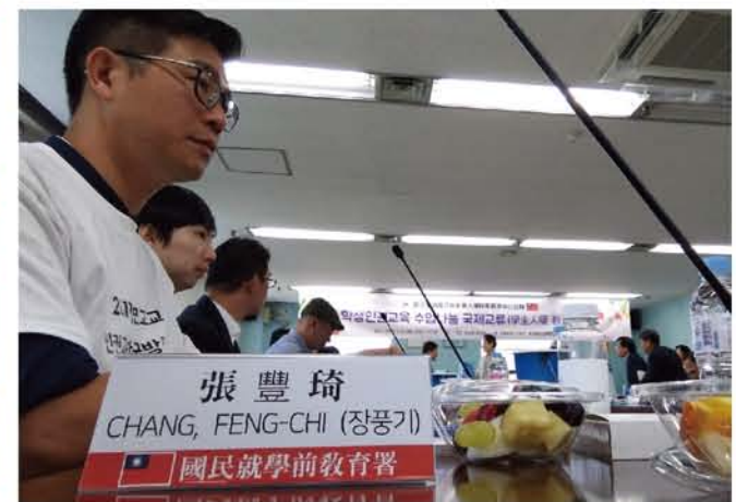
20190521 與首爾教育監教育交流會議現場，人權教育交流人權外交雙管齊下