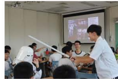
交流現場氣氛熱絡