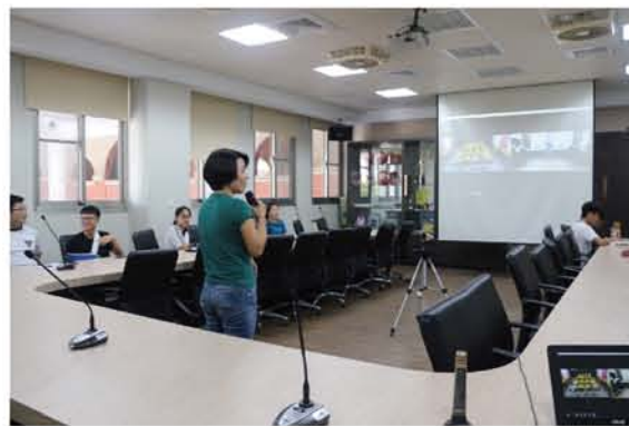
與馬來西亞濱華中學視訊交流