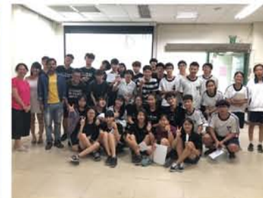
與 218 交流的大合照