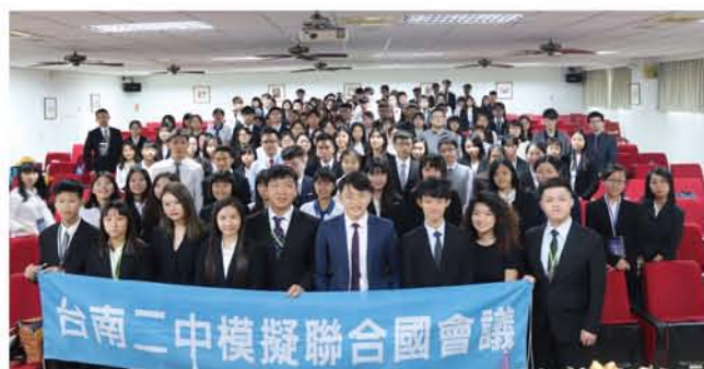
來自全臺各地高中的與會學生大合照