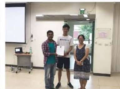
賴莞容老師與學生代表頒發感謝狀