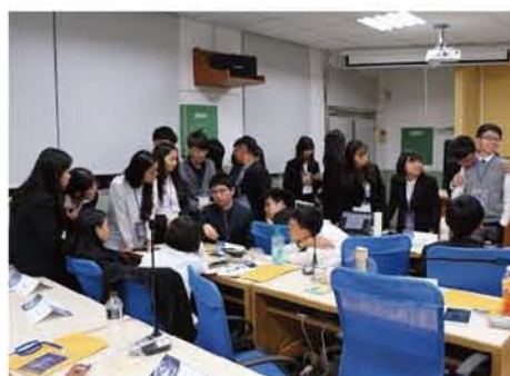
經濟人權社會理事會開會情況