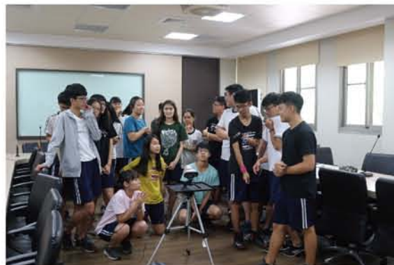
所有學生很熱情地到視訊鏡頭前與對方學生道再見