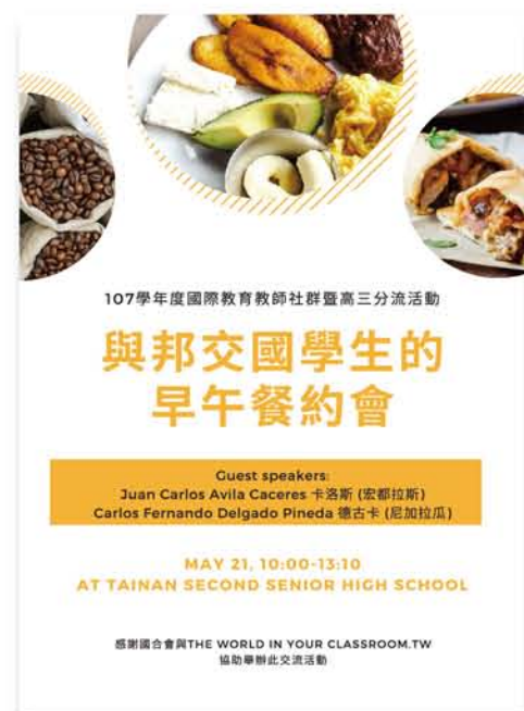
107 學年度高三分流活動海報

我認為能夠有機會與其他國家的人互相交流，是一件十分值得珍惜的事；不只認識了新朋友，更是以尊重與欣賞的精神去感受文化間的差異及美好！