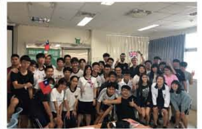
與 212 的大合照