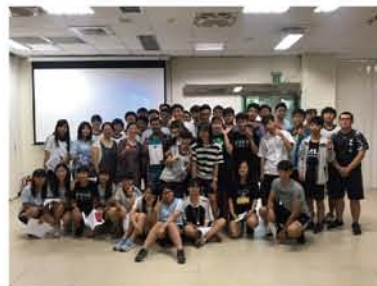
與 205 交流的大合照

老師所帶來的內容，真的是豐富極了，氣候、地形、食物……應有盡有，連我最想探討的「種姓制度」也不放過。我真的很榮幸能參與其中，也期望能有下一次，因為經歷過一節課，真的會有股「再來一次」的衝動啊！