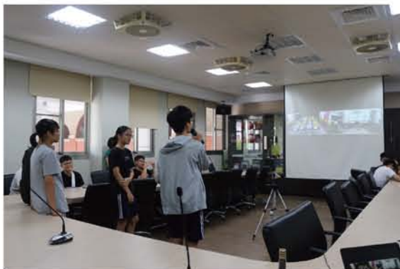
學生分組上前提問