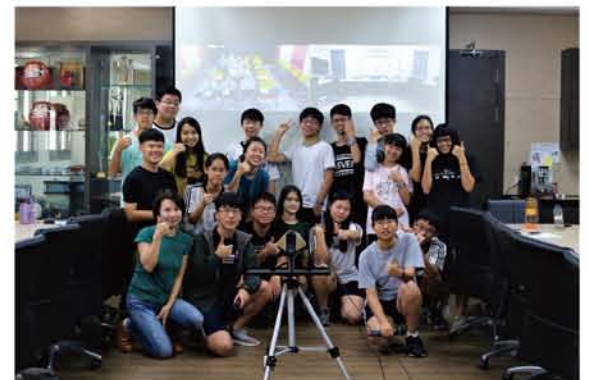
與視訊內的濱華中學穆斯林學生大合照