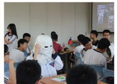
試戴星際大戰角色的頭盔