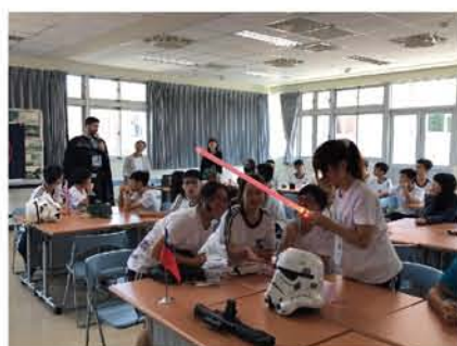
社團學生試用角色扮演的道具