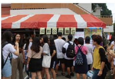
5月25日園遊會當日攤位狀況