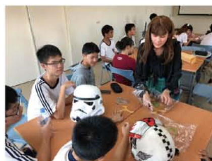
在社師的帶領下，學生拿出自製的角色扮演道具向兩位英國人分享