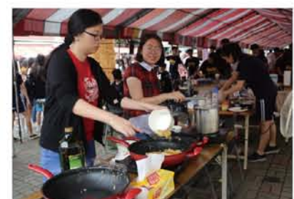
園遊會現場製作印尼道地炒泡麵