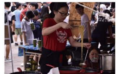
園遊會現場製作印尼道地炒泡麵