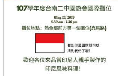
107 園遊會國際美食公益攤位傳單