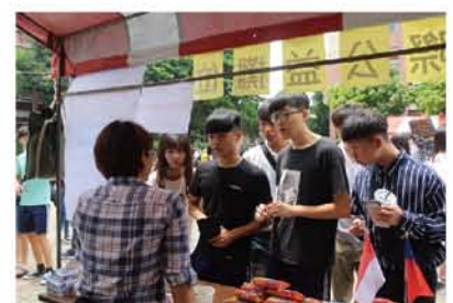
感謝到場支持的所有人和我們一同用美食做公益！