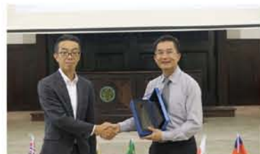
兩校校長互贈禮物