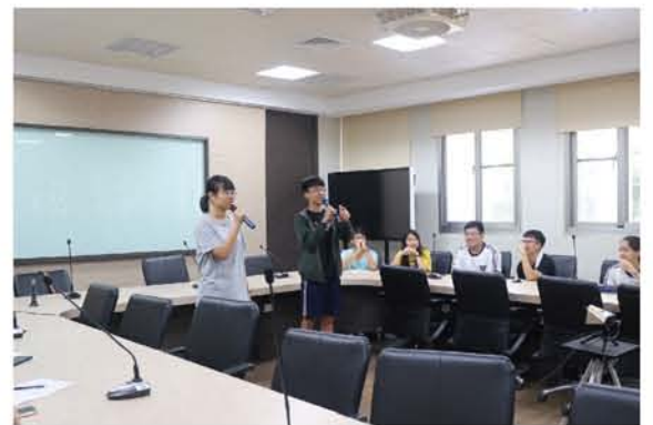
兩位學生主持人與濱華中學的穆斯林學生做自我介紹