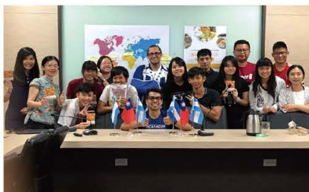
活動結束前的大合照