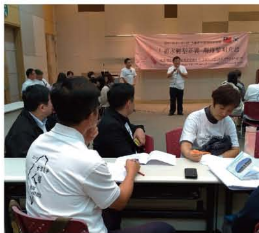
20190518 在韓國光州的第一場人權教育課程設計研討會，與會的中學教師與大學教授們群策群力進行腦力激盪