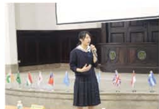
日方代表學生致詞