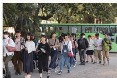
日本師生抵達二中