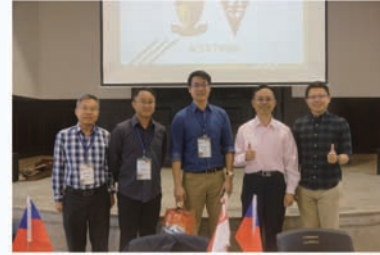
雙方代表師長合照