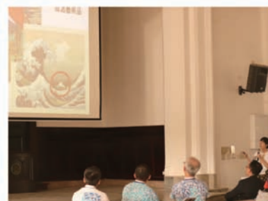
日本學生代表致詞並感謝台灣在311海嘯時給予的幫助