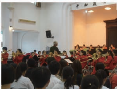
演奏時邀請觀眾一同鼓掌炒熱氣氛