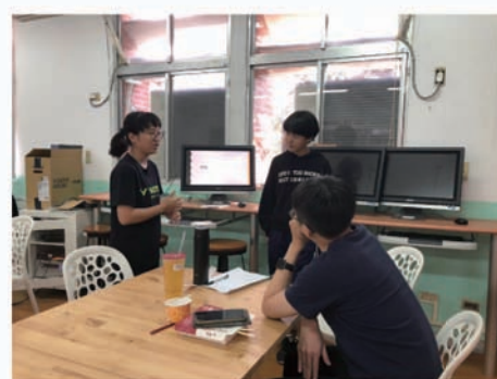
學生講者試講和練習