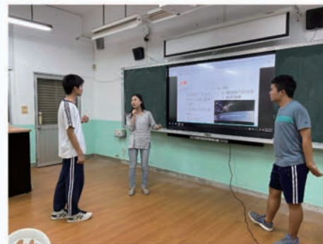
菀誼組長提醒學生演講時的站姿與台風