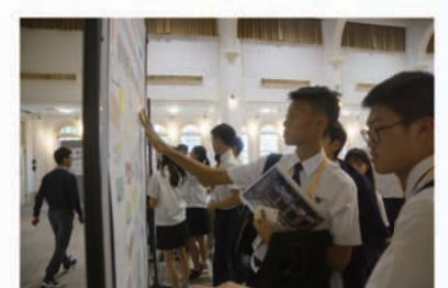
二中與新加坡學生在留言版寫下交流感言