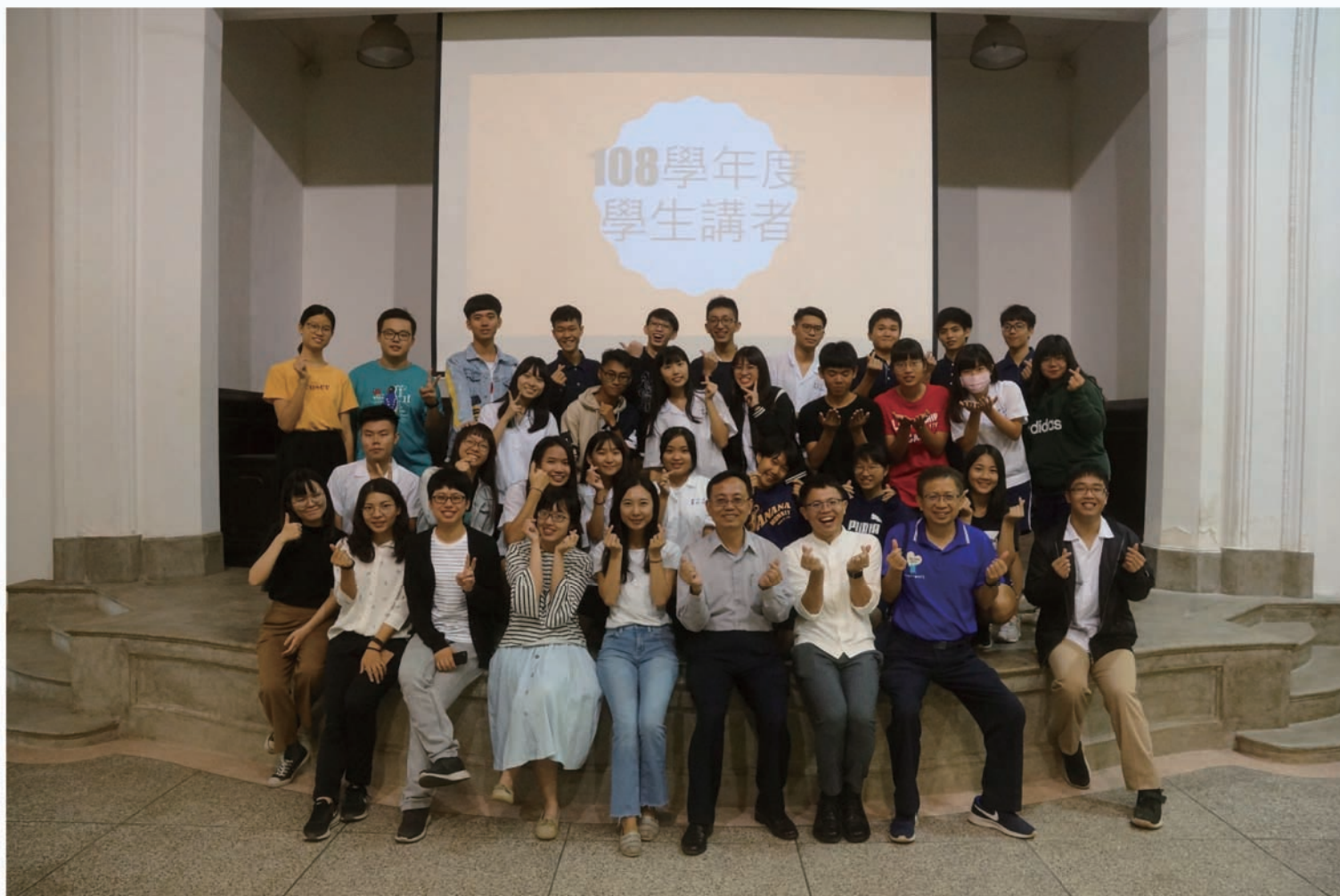
學生講者與校長、主任、組長們的大合照