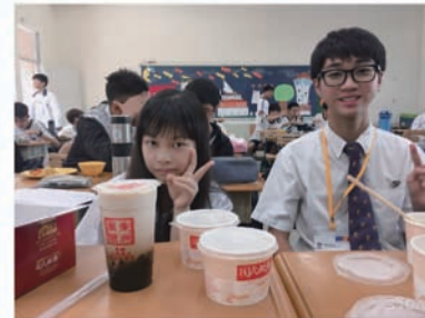
和學伴一同入班用餐