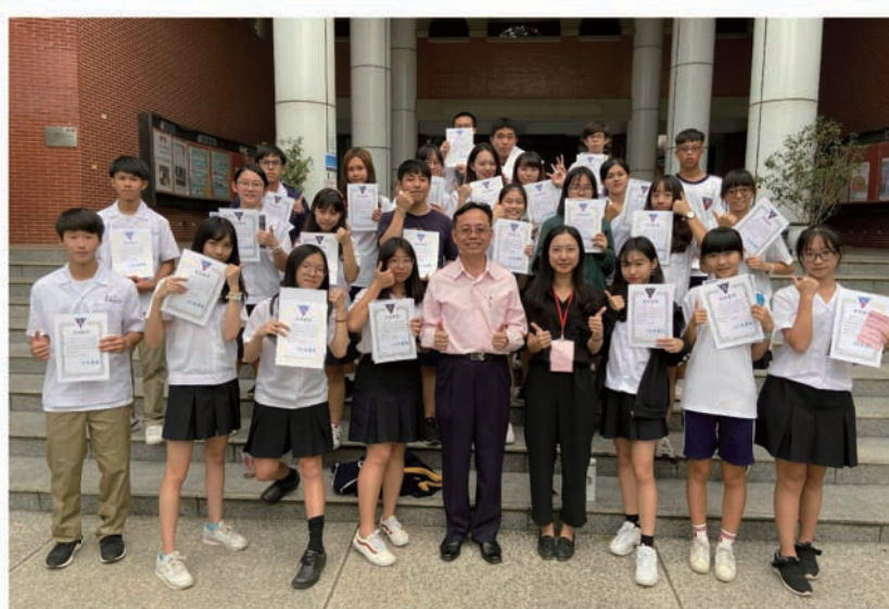
校長與社團組長頒發25位學伴參與證明書