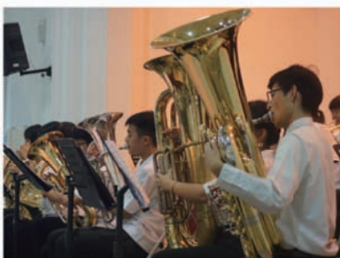
二中管樂團演出近照