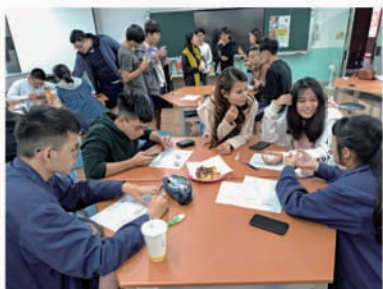
分組品嚐菲律賓零食與小組時間