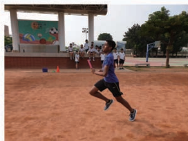
新加坡學伴參與體育課一起跑大隊接力