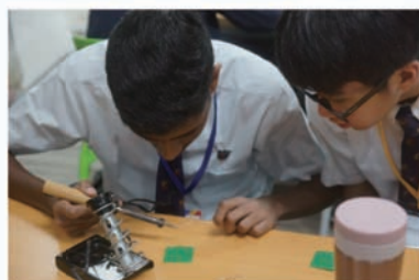
學生們認真製做紀念鑰匙圈的模樣