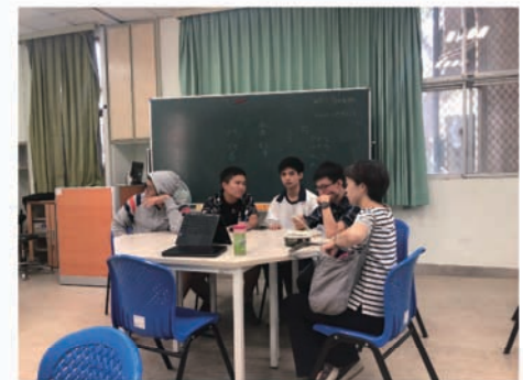
試講後和老師一同坐下來檢討