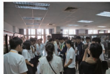
新加坡師生與學伴一同參觀生物標本室