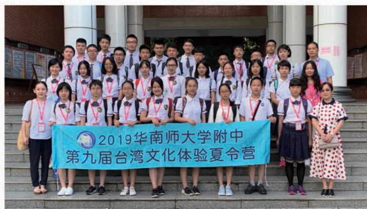
24國青年領袖Family TABLE高峰會

西方哲學家聖·奧古斯丁曾說過一句話「世界是一本書，不旅行的人只讀了一頁」，但慶幸我們生活在二中，不需要旅行，世界也會進入我們的眼簾，並藉由一次次的交流機會，拓展了我們的國際視野。各位二中人，好好把握！與其許願等待長大後存錢出國旅行，不妨先從校內的國際交流開始，期待下次的接待活動上看到你們活躍的身影喔！