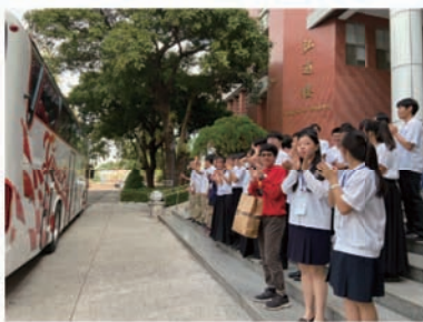
管樂社全員與二中師長一同迎接日本師生到來