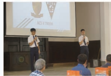
新加坡學生代表簡介自己的學校