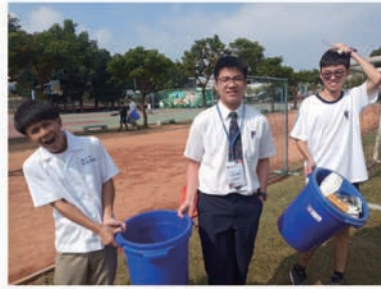
學伴一同參與掃地時間