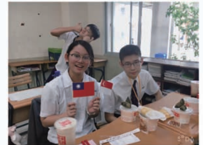
和學伴一同入班用餐