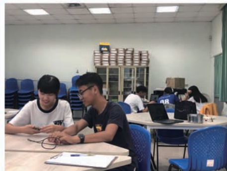
學生講者們利用午休聚在一起討論演講內容