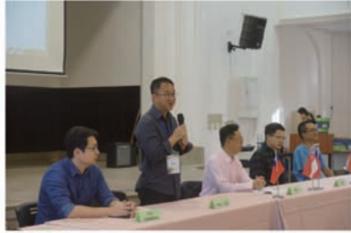
新加坡英華自主學校帶隊唐老師致詞