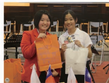
學生代表互贈禮物