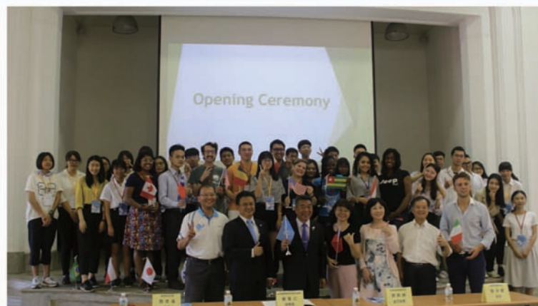
來自廣州的「華南師範大學附屬高中」