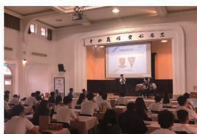
新加坡學生獻唱中文歌曲—童話