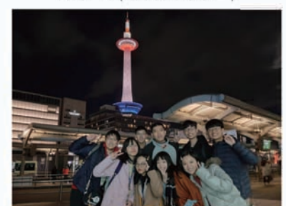
台南二中(城市探索小組四)