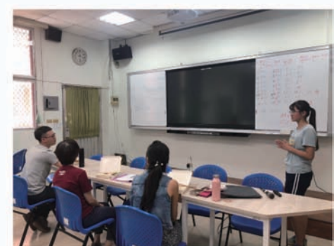
學生講者試講和練習