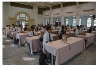
與會學生認真聆聽校園簡介的模樣