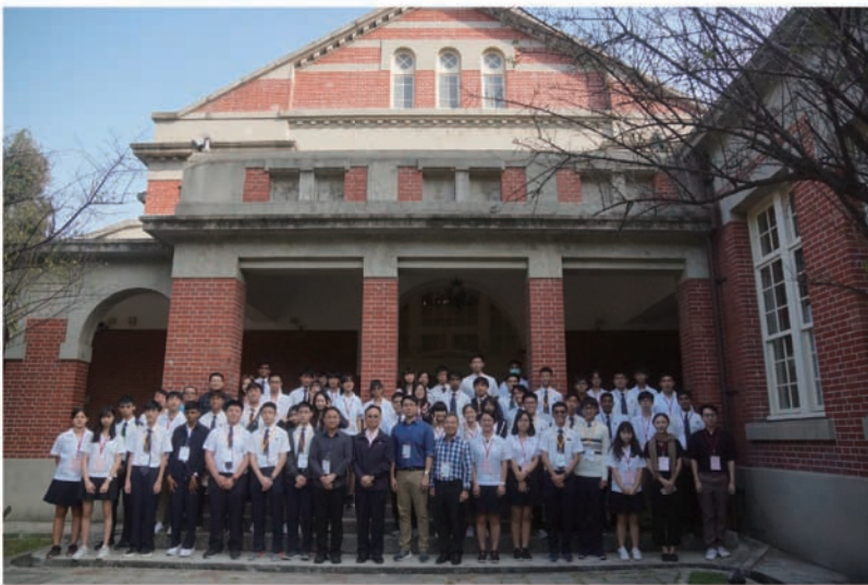
進行校園巡禮前師生大合照