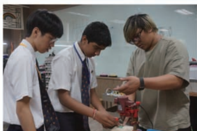
新加坡的學生學習如何使用鑽孔機