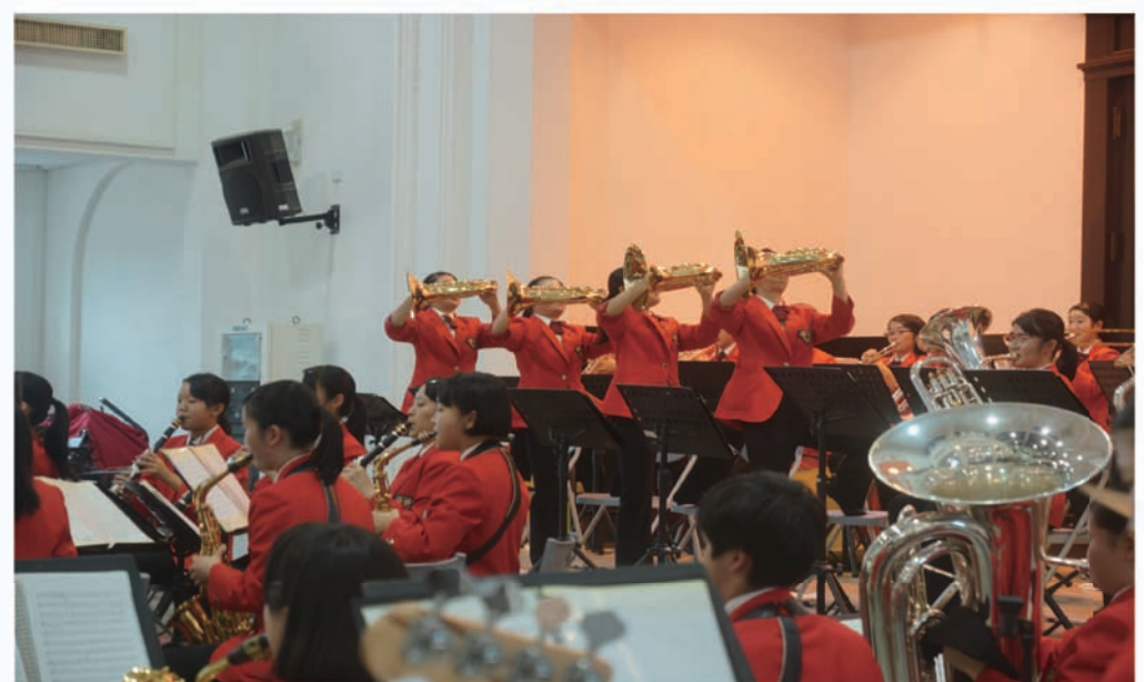
高山西高校管樂團展現精湛技巧