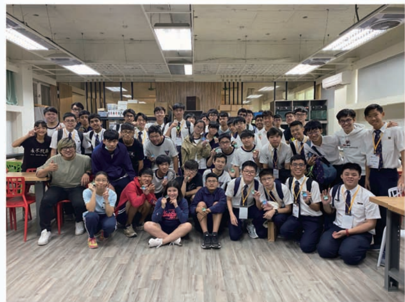
鑰匙圈完成製作大合照