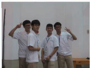
感謝辛苦的日文翻譯志工學生們