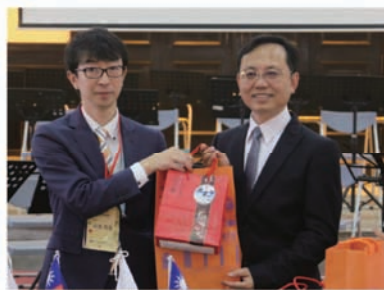
本校校長與日本代表師長互贈禮物