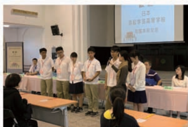
本校擔任日文史工翻譯學生自我介紹